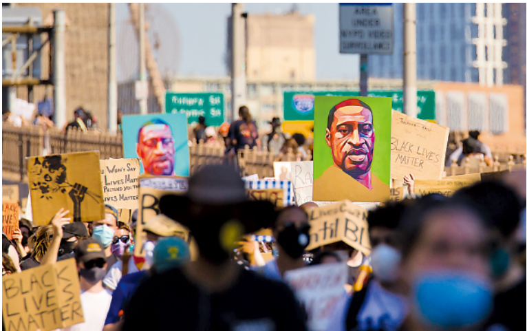
▲乔治·弗洛伊德之死在美国引发大规模抗议。这是6月9日，人们在美国纽约街头参加抗议活动。