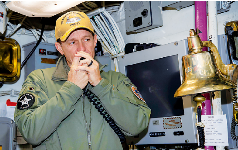
▲这是2020年1月17日拍摄的布雷特·克罗泽的资料照片。

新华社北京12月17日电（记者郑昊宁）布雷特·克罗泽4月初被美国军方“炒了鱿鱼”。夜色中，他独自走下“西奥多·罗斯福”号核动力航空母舰，走上码头。落寞身影后，舰上大约2000名水兵为他鼓掌送行、高声呼喊“克罗泽舰长”。