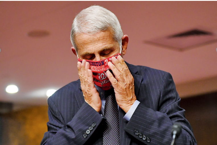
▲这是6月30日，安东尼·福奇出席参议院卫生、教育、劳工与养老金委员会听证会。

新华社北京12月17日电（记者杜鹏）美国传染病专家安东尼·福奇今年频繁亮相公共场合，为抗击新冠疫情讲述真相、奋力疾呼，获称“抗疫队长”。