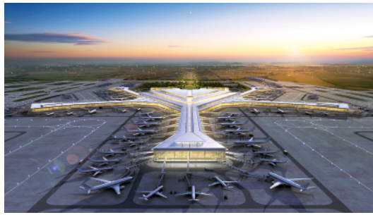
长沙机场改扩建工程启动 12月3日,总投资约430.2亿元的长沙机场改扩建暨综合交通枢纽工程正式启动(T3航站楼效果图)。