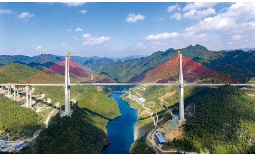
贵州遵余高速湘江大桥贯通 12月3日,贵州遵(遵义)余(余庆)高速湘江大桥顺利实现贯通,为全线建成奠定了坚实的基础(11月16日摄)。