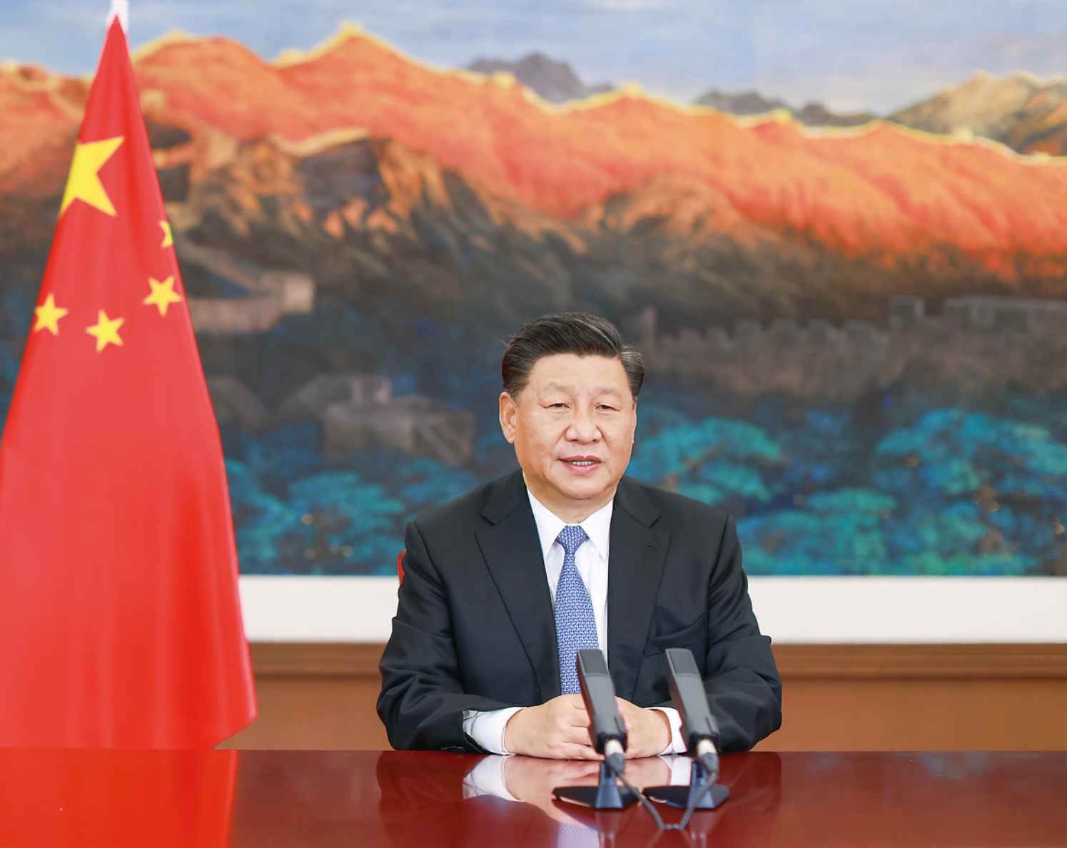
▲ 11月27日,国家主席习近平在第十七届中国—东盟博览会和中国—东盟商务与投资峰会开幕式上致辞。

新华社北京11月27日电 国家主席习近平27日在第十七届中国—东盟博览会和中国—东盟商务与投资峰会开幕式上致辞。 习近平强调,2013年,我提出愿同东盟国家共建21世纪海上丝绸之路,携手共建更为紧密的中国—东盟命运共同体。7年来,中国—东盟关系已成为亚太区域合作中最为成功和最具活力的典范,成为推动构建人类命运共同体的生动例证。面对新冠肺炎疫情,双方守望相助,共克时艰。当今世界正在经历百年未有之大变局,各国人民的命运从未像今天这样紧密相连。中方视东盟为周边外交优先方向 and 高质量共建“一带一路”重点地区,愿同东盟推进各领域合作,维护本地区繁荣发展良好势头,建设更为紧密的中国—东盟命运共同体。 第一,提升战略互信,深入对接发展规划。依托陆海新通道建设,加强基础设施互联互通合作,加快推进现有经济走廊和重点项目建设,积极构建中国—东盟多式联运联盟。明年是中国—东盟建立对话关系30周年,中方愿同东盟一道,打造更高层次的战略伙伴关系。 第二,提升经贸合作,加快地区经济全面复苏。进一步实施好中国—东盟自由贸易协定。中方希望《区域全面经济伙伴关系协定》尽早生