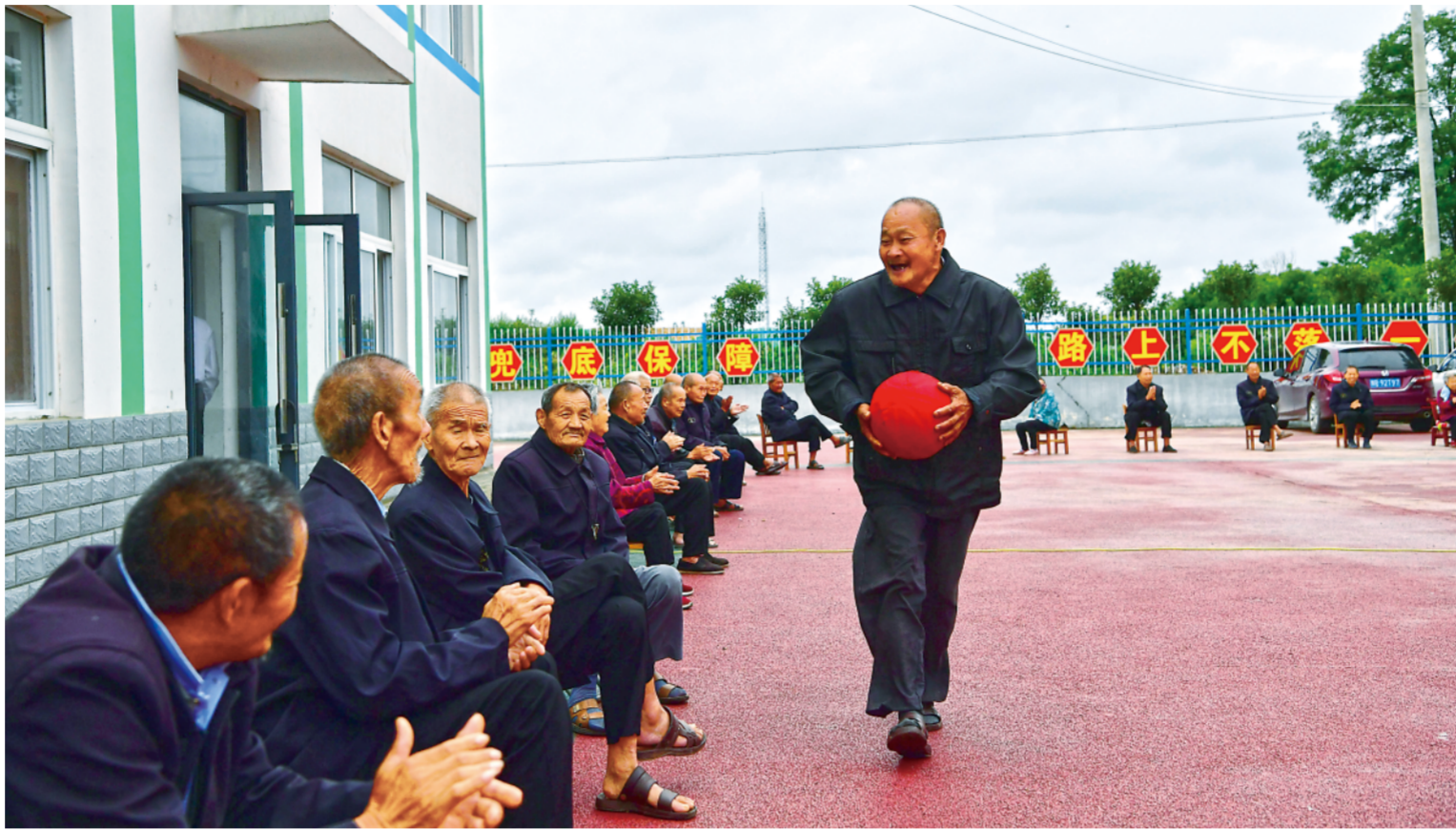
▲老人们在河南省南阳市新野县上港乡中心敬老院一起做游戏(6月17日摄)。2020年起,河南省南阳市对贫中之贫、困中之困的人员实行村级幸福大院集中托养、乡镇敬老院集中供养、社会福利机构集中托养、卫生机构集中治疗康复“四集中”的办法,确保脱贫路上一个不落。