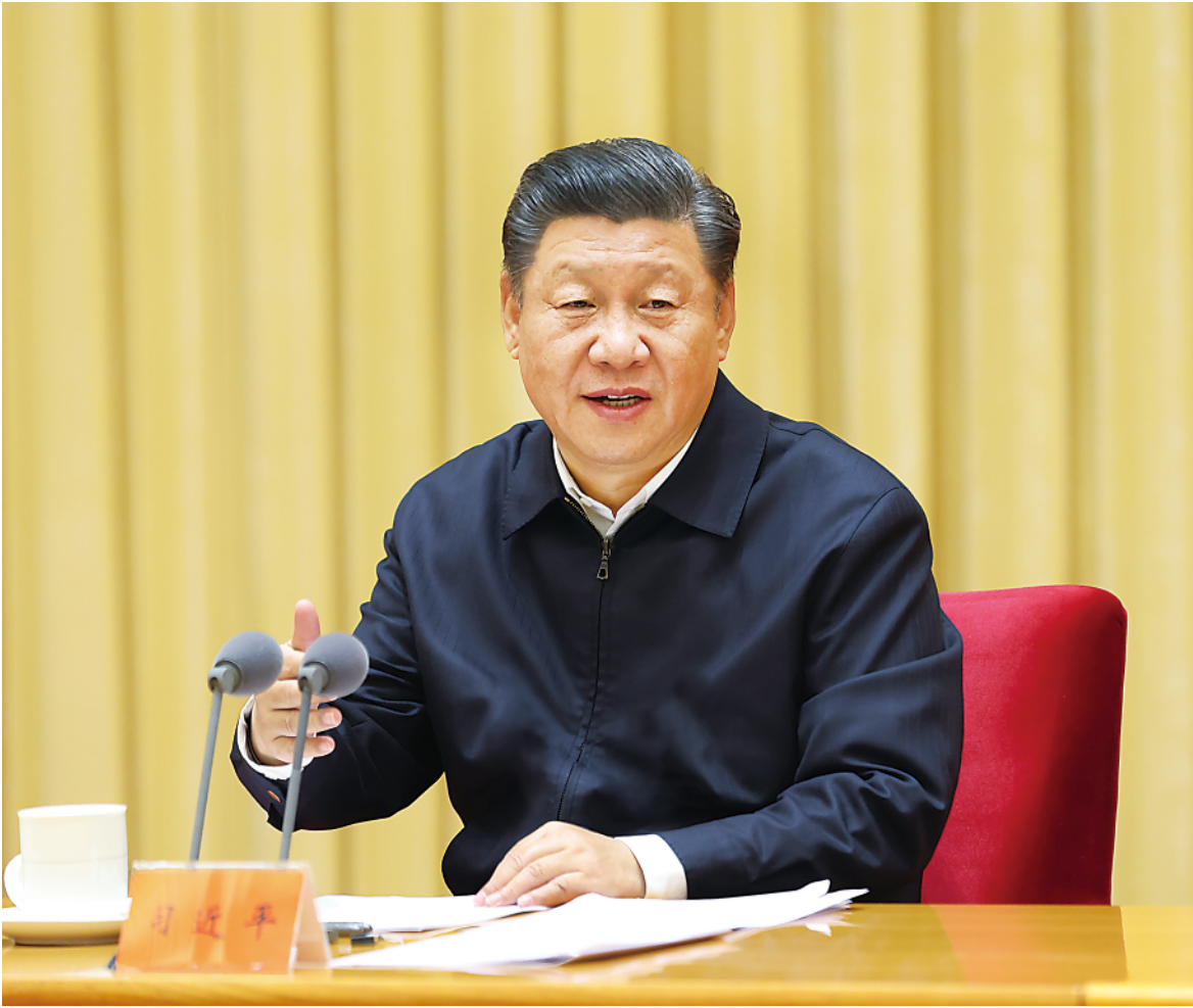
▲11月16日至17日,中央全面依法治国工作会议在北京召开。中共中央总书记、国家主席、中央军委主席习近平出席会议并发表重要讲话。

新华社北京11月17日电中央全面依法治国工作会议11月16日至17日在北京召开。中共中央总书记、国家主席、中央军委主席习近平出席会议并发表重要讲话,强调推进全面依法治国要全面贯彻落实党的十九大和十九届二中、三中、四中全会精神,从把握新发展阶段、贯彻新发展理念、构建新发展