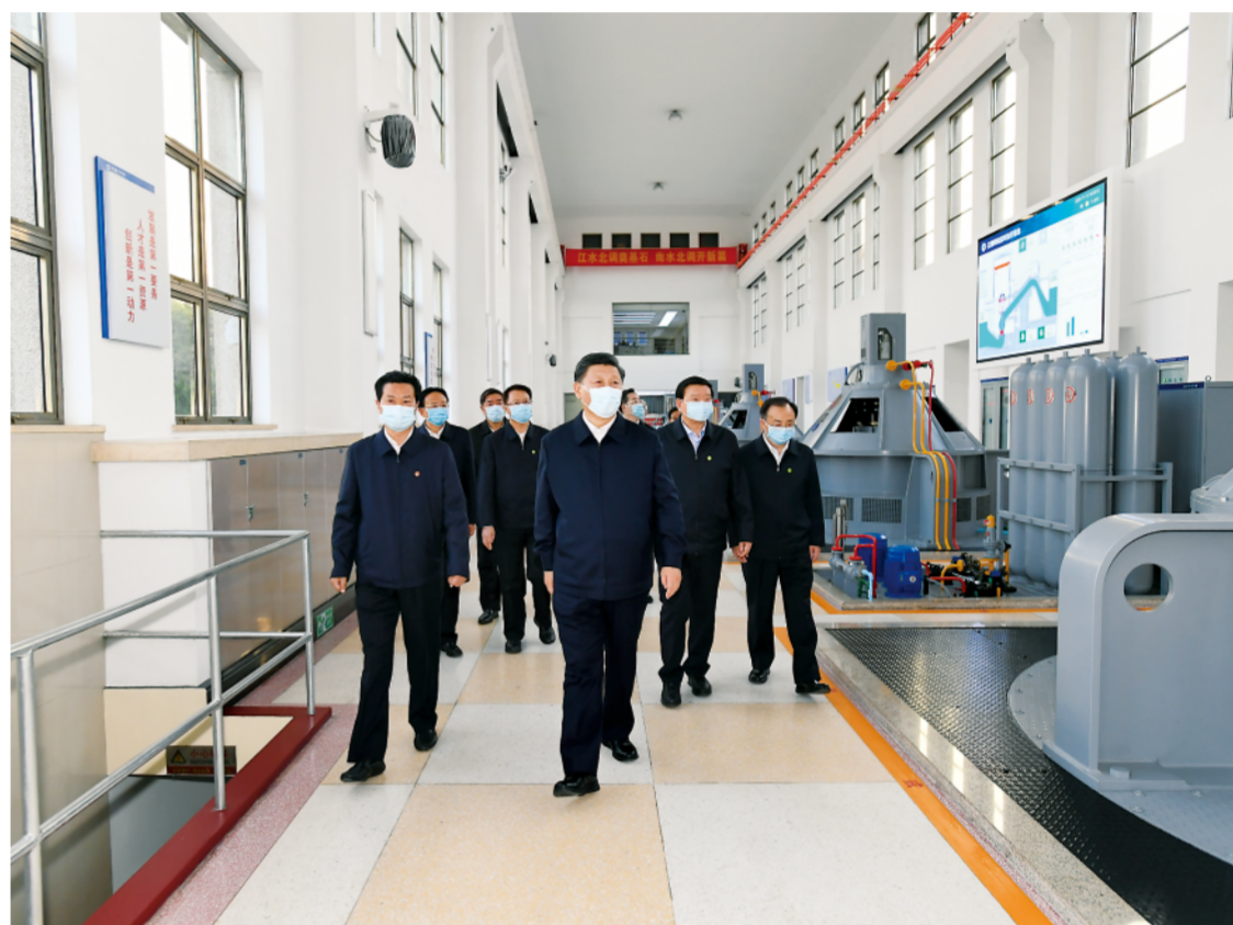
▲这是13日下午，习近平在扬州市江都水利枢纽第四抽水站，察看水泵运行情况。