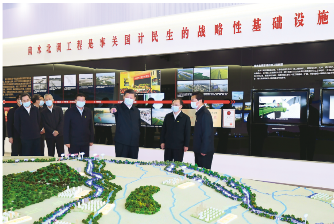
▲这是13日下午，习近平在扬州市江都水利枢纽展厅，了解南水北调东线工程规划和运行情况。