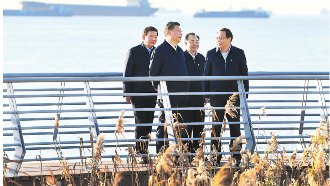
▲这是12日下午，习近平在南通市五山地区滨江片区，沿江边步行察看滨江生态环境。