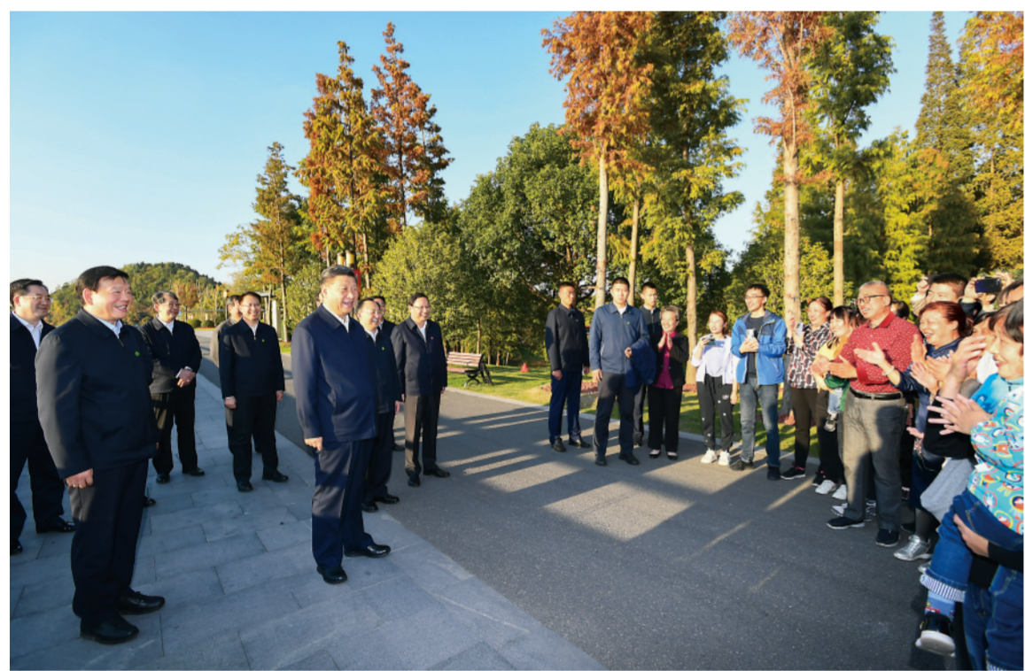
▲这是12日下午，习近平在南通市五山地区滨江片区考察时，同市民群众亲切交流。