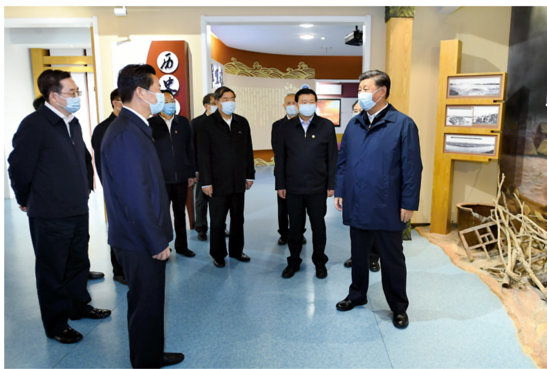
▲这是13日下午，习近平在扬州市江都水利枢纽展览馆参观，了解水利枢纽工程发展建设历程和运营情况。