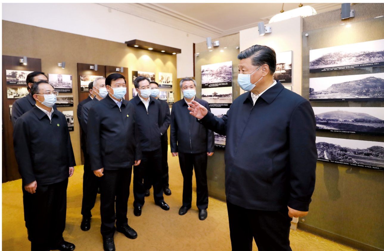
▲这是12日下午，习近平在南通博物苑张謇故居参观，了解张謇兴办实业、教育和社会公益事业的情况。

11月12日至13日，中共中央总书记、国家主席、中央军委主席习近平在江苏考察。习近平在考察时强调，要全面把握新发展阶段的新任务新要求，坚定不移贯彻新发展理念、构建新发展格局，坚持稳中求进工作总基调，统筹发展和安全，把保护生态环境摆在更加突出的位置，推动经济社会高质量发展、可持续发展，着力在改革创新、推动高质量发展上争当表率，在服务全国构建新发展格局上争做示范，在率先实现社会主义现代化上走在前列。