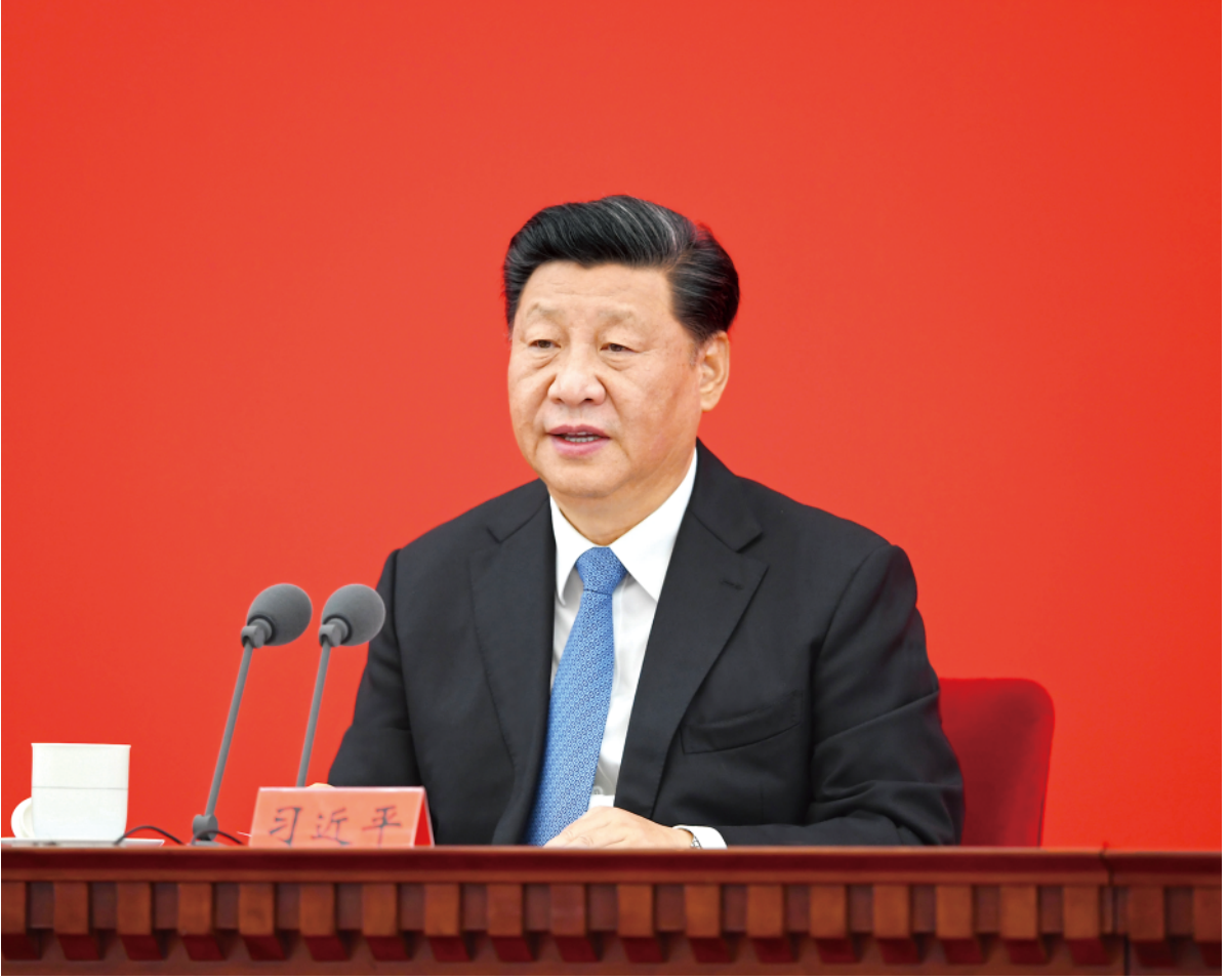
▲ 11 月 12 日,浦东开发开放 30 周年庆祝大会在上海市举行。中共中央总书记、国家主席、中央军委主席习近平在会上发表重要讲话。

新华社上海 11 月 12 日电浦东开发开放 30 周年庆祝大会 12 日上午在上海市举行。中共中央总书记、国家主席、中央军委主席习近平在会上发表重要讲话强调,要抓住机遇、乘势而上,全面贯彻党的十九大和十九届二中、三中、四中全会精神,科学把握新发展阶段,坚决贯彻新发展理念,服务构建新发展格局,坚持稳中求进工作总基调,勇于挑最重的担子、啃最硬的骨头,努力成为更高水平改革开放的开路先锋、全面建设社会主义现代化国家的排头兵、彰显“四个自信”的实践范例,更好向世界展示中国理念、中国精神、中国道路。