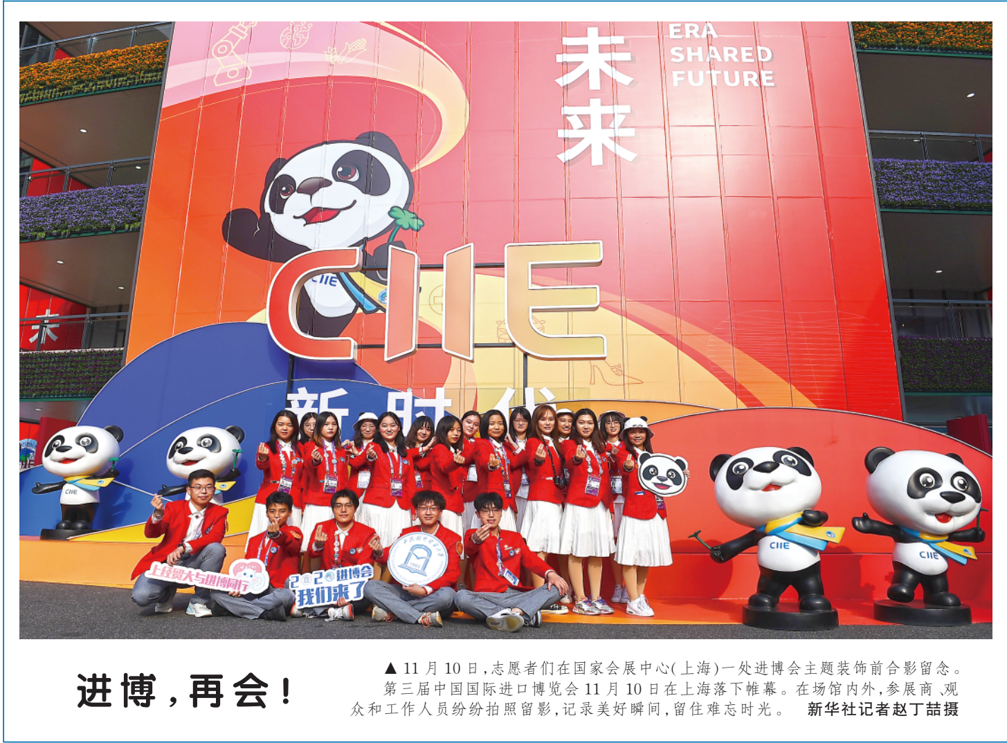
▲11月10日,志愿者们在国家会展中心(上海)一处进博会主题装饰前合影留念。 第三届中国国际进口博览会11月10日在上海落下帷幕。在场馆内外,参展商、观众和工作人员纷纷拍照留影,记录美好瞬间,留住难忘时光。