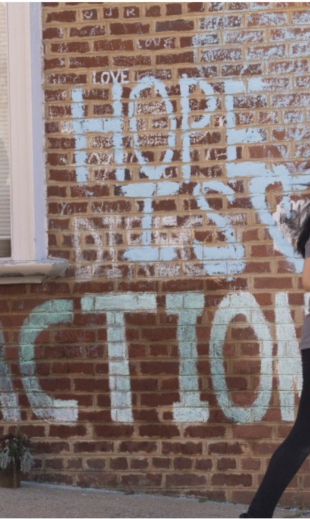
▲这是10月20日在美国弗吉尼亚州夏洛茨维尔拍摄的曾发生暴力事件的地点。

今年8月,拜登在接受2020年民主党总统候选人提名时发表讲话说,正是夏洛茨维尔事件及特朗普的反应让他下定决心竞选总统,他宣称要为“美国的灵魂”而战。 夏洛茨维尔骚乱后,美国极右势力在各界合力打压下遭遇重创,但并未消失。美国联邦调查局局长克里斯托弗·雷今年9月到国会出席听证会时说,他们处理的本土恐怖主义威胁中受种族驱使的暴力极端主义案件数量最多,而这些案件大多数涉及白人至上主义者。 美国近期一系列民调显示,多数美国人认为种族关系在美国正在恶化。拥有欧洲和亚洲血统的夏洛茨维尔当地居民罗恩·雷耶斯对记者说,种族主义在美国一直存在,但过去几年,美国变得更加撕裂,种族主义问题因此尤为突出。 美国圣安塞尔姆学院政治学专家克里斯托弗·加尔迪耶里指出,实际上种族主义并没有离开美国政治和生活。民权法律法规无法一下子根除几个世纪以来的痼疾,种族主义问题在一些领域依然触目惊心。 就在今年5月,美国种族主义的伤疤再一次被狠狠掀起——明尼苏达州明尼阿波利斯市白人警察暴力执法造成非裔男子乔治·弗洛伊德死亡,触犯众怒,全美范围