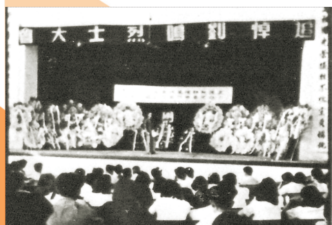
▲1952年8月23日新华社总社全体工作人员在大礼堂举行追悼刘鸣烈士大会。图为大会会场。