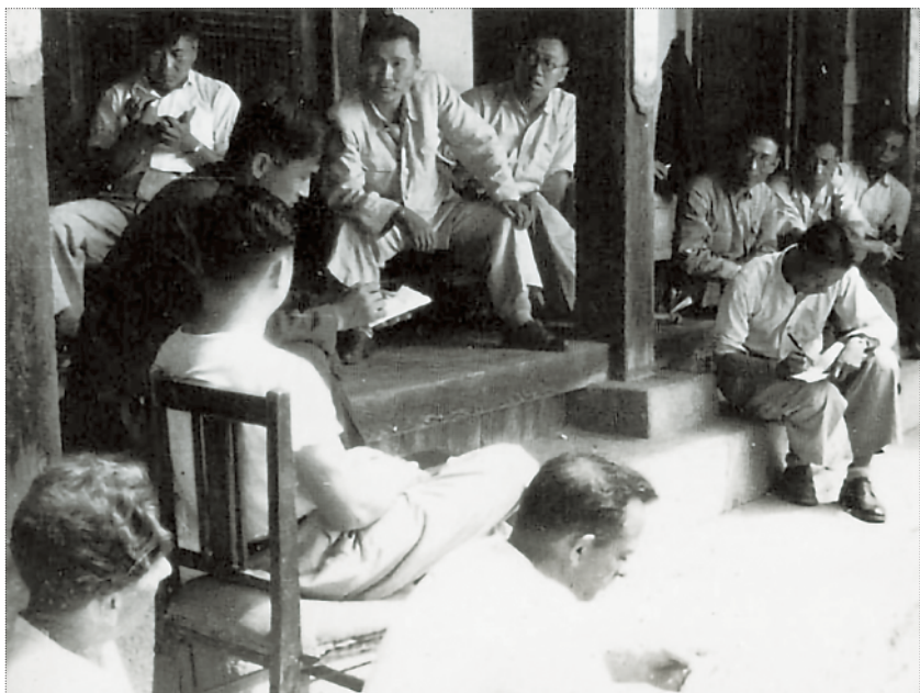
▲抗美援朝期间，赴朝采访的新华社记者及外国同行听取朝鲜民主主义人民共和国宣传省副省长介绍战事情况。