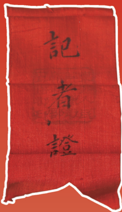
▲抗美援朝时期新华社记者证件。