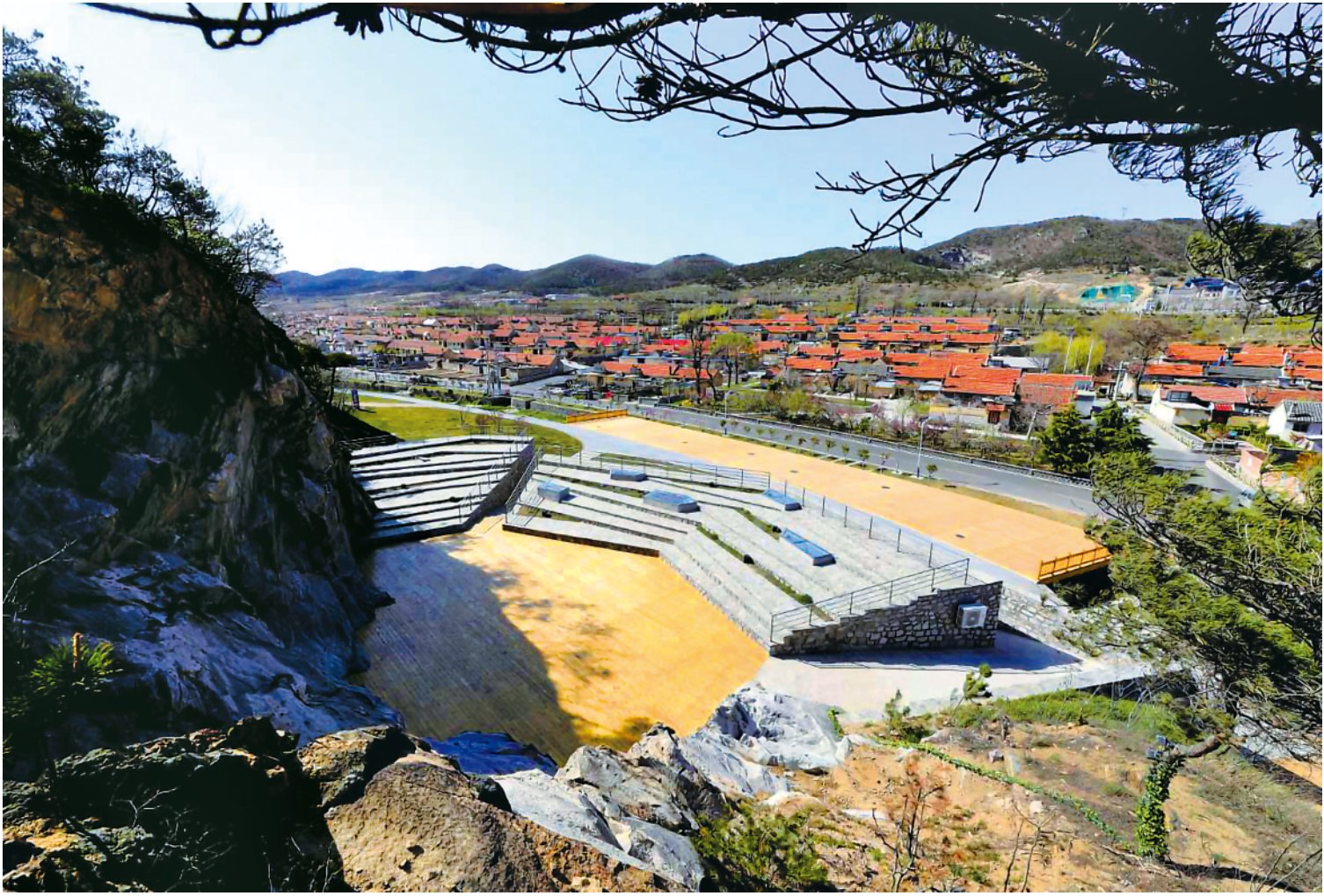
▲这是威海市环翠区嵩山街道五家疃村石窝剧场（资料照片）。

新华社济南10月20日电（记者王阳）金秋十月，依山傍海的威海环境优美，空气清新，气候宜人。