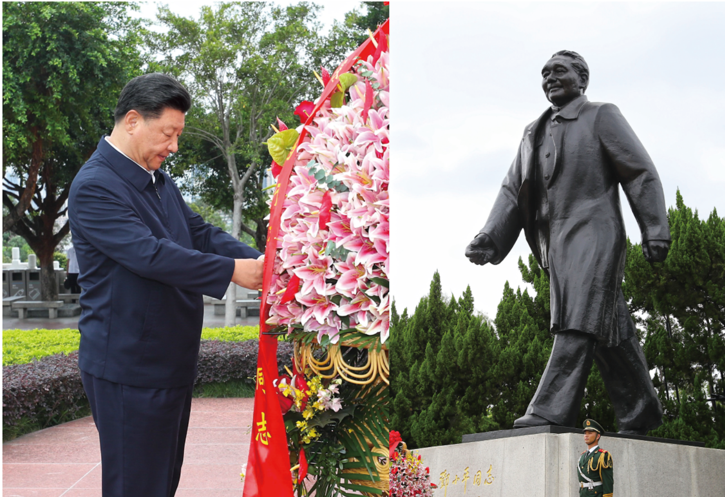
▲ 10 月 14 日，深圳经济特区建立 40 周年庆祝大会在广东省深圳市隆重举行。中共中央总书记、国家主席、中央军委主席习近平在会上发表重要讲话。这是当天下午，习近平来到莲花山公园，向邓小平同志铜像敬献花篮。