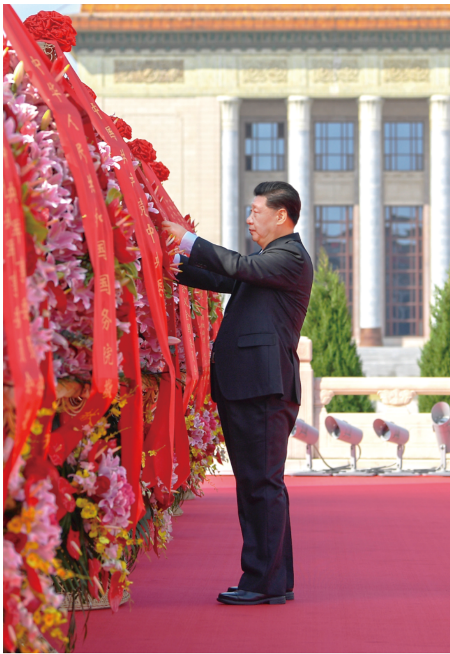
▲9月30日上午，党和国家领导人习近平、李克强、栗战书、汪洋、王沪宁、赵乐际、韩正、王岐山等来到北京天安门广场，出席烈士纪念日向人民英雄敬献花篮仪式。这是习近平整理花篮上的缎带。