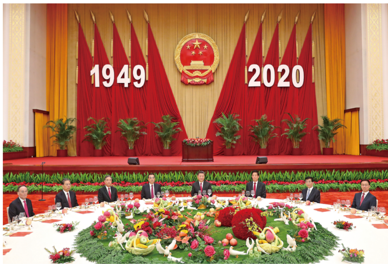
▲9月30日晚，国务院在北京人民大会堂举行国庆招待会，热烈庆祝中华人民共和国成立七十一周年。习近平、李克强、栗战书、汪洋、王沪宁、赵乐际、韩正、王岐山等党和国家领导人与中外人士欢聚一堂，共庆共和国华诞。

新华社北京9月30日电9月30日晚，国务院在人民大会堂举行国庆招待会，热烈庆祝中华人民共和国成立七十一周年。习近平、李克强、栗战书、汪洋、王沪宁、赵乐际、韩正、王岐山等党和国家领导人与近500位中外人士欢聚一堂，共庆共和国华诞。 人民大会堂宴会厅鲜花绽放，洋溢着热烈喜庆的节日气氛。主席台上方，庄严的国徽高悬，“1949-2020”的大字年号在鲜艳的红旗映衬下格外醒目。 17时30分许，伴随着欢快的《迎宾