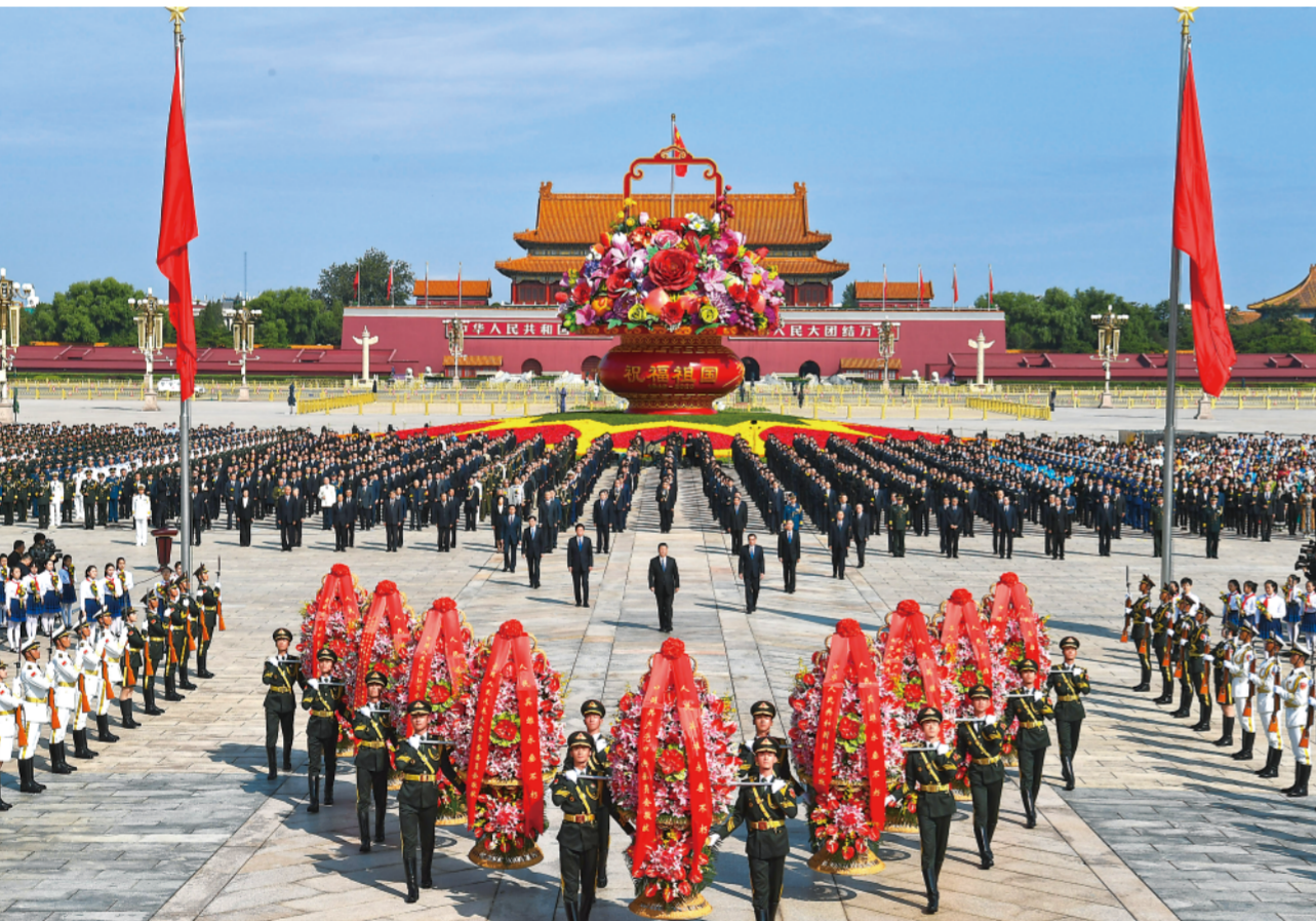
▼9月30日上午，党和国家领导人习近平、李克强、栗战书、汪洋、王沪宁、赵乐际、韩正、王岐山等来到北京天安门广场，出席烈士纪念日向人民英雄敬献花篮仪式。

新华社北京9月30日电缅怀革命先烈，弘扬英雄精神。烈士纪念日向人民英雄敬献花篮仪式30日上午在北京天安门广场隆重举行。党和国家领导人习近平、李克强、栗战书、汪洋、王沪宁、赵乐际、韩正、王岐山等，同各界代表一起出席仪式。 庄严的天安门广场上，鲜艳的五星红旗高高飘扬，人民英雄纪念碑巍然耸立。广场中央，“祝福祖国”巨型花篮表达着对国家繁荣富强的美好祝愿，花篮上“万众一心”字样格外醒目。 临近10时，习近平、李克强、栗战书、汪洋、王沪宁、赵乐际、韩正、王岐山等党和国家领导人来到天安门广场，出席向人民英雄敬献花篮仪式。 中国人民解放军军乐团小号手吹响嘹亮悠远的《烈士纪念日号角》。 “礼兵就位！”三军仪仗兵迈着铿锵有力的步伐，正步行进到纪念碑前持枪伫立。 10时整，向人民英雄敬献花篮仪式正式开始。军乐团奏响《义勇军进行曲》，全场齐声高唱中华人民共和国国歌。 国歌唱毕，全场肃立，向为中国人民解放事业和共和国建设事业英勇献身的烈士默哀。