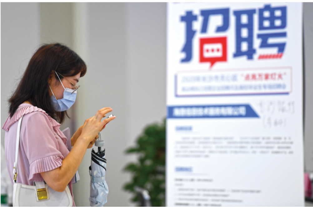
▲2020年“点亮万家灯火”就业帮扶之民营企业招聘月及高校毕业生专场招聘会在湖南长沙天心区举行,通过线上线下联动方式助力企业招聘和求职者就业(7月30日摄)。

“今年,教育部扩大了中小学、幼儿园教师及特岗教师的招聘规模,推出了‘先上岗、再考证’的重要举措,起到了‘稳就业’‘保就业’的重要作用,也有助于基层教育系统师资队伍的发