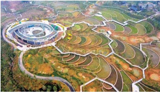
工业废弃地变身园博盛景 在邯郸市举行的河北省第四届园博会所在地此前是一片工业废弃地，通过采取生态修复进行综合整治，成功转身（9月23日摄）。