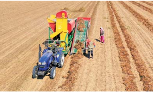
收获花生机械来帮忙 正值辽宁台安县花生收获的季节，广大农民抢抓农时，运用农业机械适时收获，田间地头一派繁忙景象（9月23日摄）。