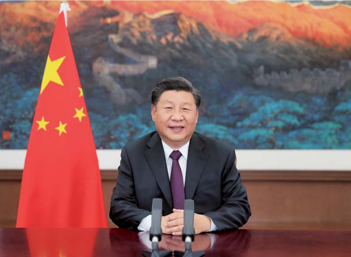
▲9月4日，国家主席习近平在2020年中国国际服务贸易交易会全球服务贸易峰会上致辞。

强调各国要共同营造开放包容的合作环境、共同激活创新引领的合作动能、共同开创互利共赢的合作局面，中国将坚定不移扩大对外开放，继续放宽服务业市场准入，发展服务贸易新业态新模式，支持组建全球服务贸易联盟，支持北京打造国家服务业扩大开放综合示范区，带动形成更高层次改革开放新格局