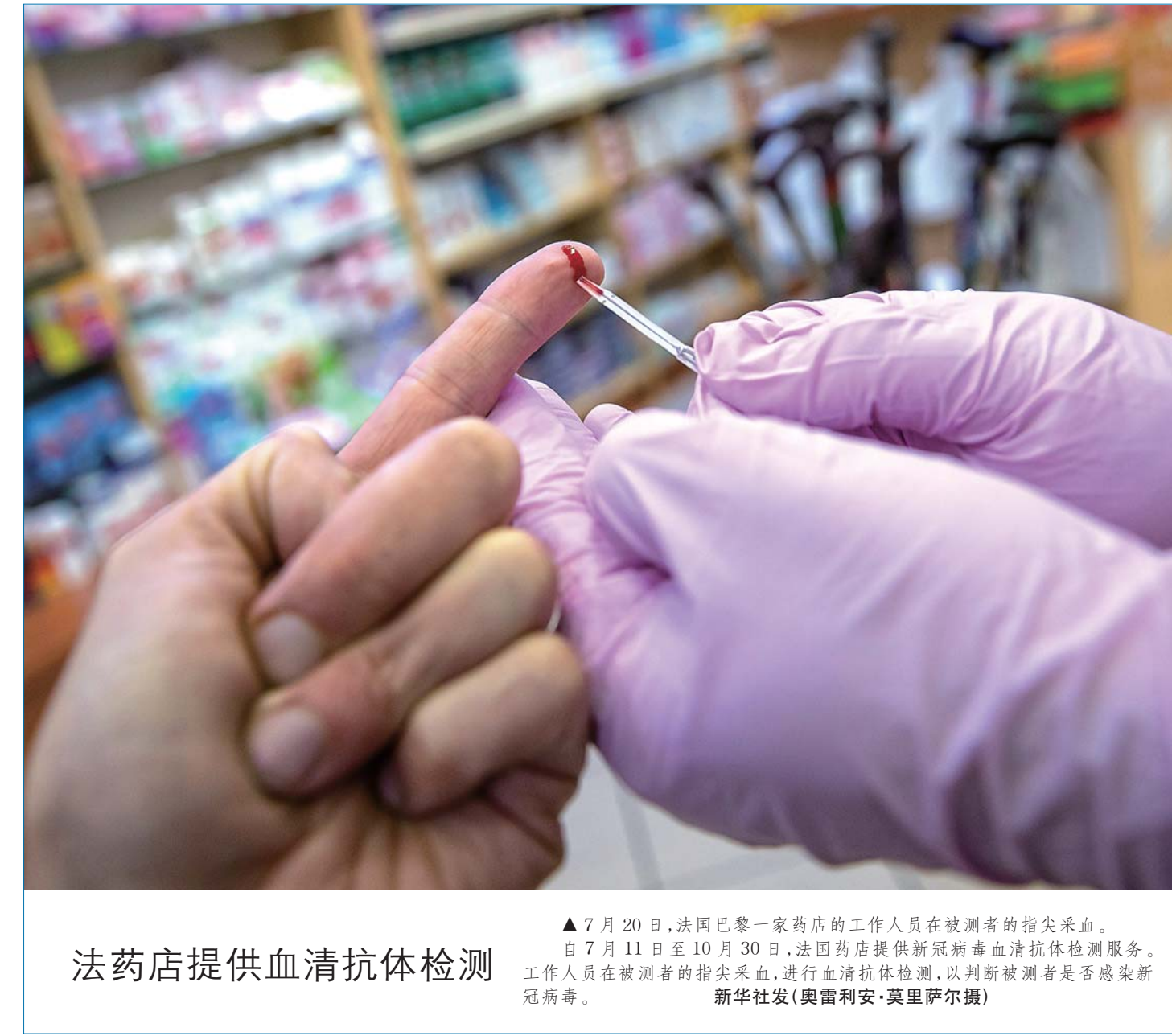
法药店提供血清抗体检测

新华社记者 英国外交大臣拉布20日在议会下院宣布,英方将立即、无期限地暂停与香港引渡协定,并禁止向香港出口有关武器。英方不顾中方严正立场和一再交涉,再次违反国际法和国际关系基本准则,粗暴干涉中国内政,企图干扰香港国安法实施,破坏香港繁荣稳定,包括香港同胞在内的14亿中国人民对此坚决反对。 香港事务纯属中国内政,不容任何外国干涉。不干涉内政是国际关系的基本准则。中国政府根据“一国两制”方针,依法行使对港全面管治权,而唐宁街却不懂得尊重中方维护自身主权和安全的正当权利。企图通过暂停引渡协定之类的“小动作”施压中方,不得逞。 国安法于法有据、符合规范,国际事务不容双标。香港国安法完全符合中国宪法和香港基本法有关规定,符合通行规则和国际规范。香港国安法是确保“一国两制”行稳致远、确保香港长治久安和繁荣稳定的“定海神针”。英国历来也通过相关立法维护国家安全。英国对香港进行殖民统治期间,英国的《叛逆法》就在香港适用,且有专门执行机构。英国政府此番对香港国安法说三道四,无疑是赤裸裸的双重标准。