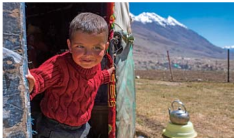
▲在新疆塔什库尔干塔吉克自治县帕尔帕克夏牧场上,小朋友在毡房门口玩耍。