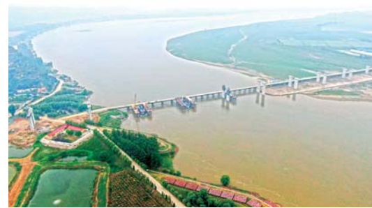
孟州黄河大桥加紧建设

目前,国道207河南孟州黄河大桥正在加紧建设。孟州黄河大桥主桥全长3007米,计划2021年10月建成通车。