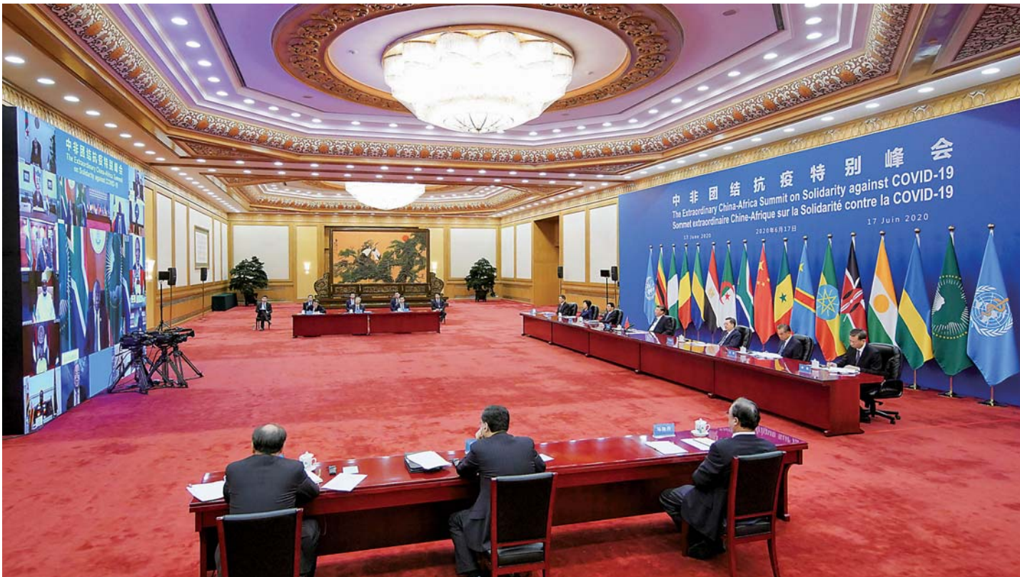
▲ 6 月 17 日晚，国家主席习近平在北京主持中非团结抗疫特别峰会并发表题为《团结抗疫 共克时艰》的主旨讲话。