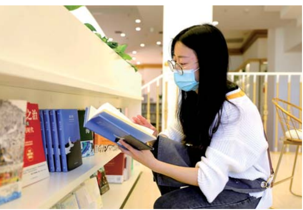
▲ 4 月 23 日，读者在河北固安县一家新华书店内阅读。

新华社南京 4 月 23 日电（记者蒋芳、冯源）4 月 23 日，迎来又一个“世界读书日”。特殊时期，新冠肺炎疫情改变了很多人的生活方式，全民阅读也呈现更加多元的变化，阅读的力量更加彰显。 你是否在“报复性”阅读？ “我喜欢科幻小说，感谢浙江图书馆的活动让我便捷地接触了这么多高质量的图书。”4 月 19 日，网友小李读完《三体》后在浙江图书馆微信公众号“21 天阅读”栏目里上传书评，签到打卡。 近期，浙江图书馆推出了“阅读静心，书香战‘疫’”系列活动，“21 天阅读”栏目为读者推荐了 15 本佳作，读者用手机扫描二维码就可以免费阅读。 随着智能终端的普及，数字化阅读日益流行。南京市民李云戏言自己在疫情过后没有“报复性消费”，反而一直在“报复性读书”。“我算了算最近的微信读书和喜马拉雅听书的总量，甚至超过了 2019 年全年。” “春日里，逛书店”在南京蔚然成风。今年 3 月，南京市面向市民摇号派发电子消费券，其中图书消费券有 700 万元，覆盖全市 198 家书店。清明小长假期间，南京书店总销售额超过 100 万元，图书消费券热度仅次于餐饮券。 4 月 23 日开幕的 2020 年中国数字阅读云上大会专门设置了行业抗疫成果展示。中国音像与数字出版协会副秘书长王勤介绍，协会于 1 月 30 日发出《数字阅读行业战“疫”倡议书》，各大网络文学平台积极参与，带动数千部获奖作品、传统文学精品和现实题材的网络文学佳作上线，《大江大河》《庆余年》《琅琊榜》等热门 IP 作品广受欢迎。 据不完全统计，2 月 1 日至 29 日，全国 60 家单位共设置了 80 余个免费阅读专区，用户总浏览量超过 52.8 亿人次，总阅读量超过 72.2 亿人次，总阅读时长超过 3.3 亿小时，总下载量超过 2.4 亿次，新增用户突破 1 亿。 全民阅读呈现新变化 每年的 4 月 23 日，各类新书推荐和阅读推广活动扎堆，今年，不少活动搬到了线上。打开一些出版社、书店或者读书会的微信公众号，就会看到密密麻麻的直播预告。 江苏人民出版社学术编辑室主任王清波近期也试水了几次直播“带货”，邀请相关领域学者共同推广《司马懿家族与魏晋历史》《诸葛亮武侯与三国时代》等书籍。他告诉记者，“带货”收益有限，但带来的关注度不可小觑，“线上分享也使更多人有机会接触、传播知识，推进全民阅读。” 科技手段正在不断开拓全民阅读“入口”。近日，北京 72 家实体书店陆续在美国外卖上线。在南京，图书馆推出了“书服到家”业务，读者可以在全市范围内实现借借还还，享受“外卖”服务。南京市建邺区图书馆工作人员介绍，世界读书日期间，读者通过“书服到家”网上借借还还，还可以领取免邮券用于预约还书，相当于超值包邮。 手机、平板看书很普遍，但很多读者仍然喜欢看纸质书，更有阅读的意境。近日，浙江图书馆推出了“无边界图书馆”业务，打通线下空间与线上平台，为读者提供更灵活的阅读体验。 24 小时书房也在恢复运营。江苏省扬州市为每个城市书房都配备了“一站式”阅读体验服务，方便读者自助办证、阅览、外借、数据库检索和二维码书刊资源下载等，书房实现无人值守，依靠人脸识别管理。“如今，24 小时书房靠的不仅是情怀和灯光，还有不断提升的数字化、智能化管理手段。”扬州市图书馆负责人说。