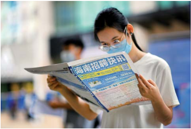
▲4月18日，求职者在看招聘信息。当日，“战疫情·促就业”大型综合性招聘会在海口市京华城举行。

复学后要把家长的痛点当工作重点 近期，根据各地防疫形势，国内一些省区已陆续开学，或已确定学生返校复课日程表。然而，随之而来的学生托管问题，成了开学后家长面临的新烦恼。 西部某省会城市近日发布通知，为确保广大中小學生健康安全，暂缓校外托护点（“小饭桌”）经营活动，违者将“依法严肃处理”。以为开学后能松口气的家长，被“小饭桌”不能恢复运营的通知，打了个措手不及。有的家长只能自己带饭在路边长椅上解决。 家长的焦虑为酒店带来“商机”。在一些城市，有酒店推出“无忧房”，为学生提供托护场所，每人每月收费1200元至1500元不等，其宣传海报上还写着“履行社会责任，为家长排忧解难”。 “无忧房”预约火爆。有酒店工作人员告诉记者，最近咨询“无忧房”的家长较多，酒店闲置客房充足，可为学生提供托管服务，并且可缓解酒店客源不足的现状。 “无忧房”暂时缓解了家长之忧，但到底能否做到“无忧”，还要画一个大大的问号。一些家长表示，与正规的学生托护点相比，酒店做托护服务缺乏专业度，从校车配备到房间布置，从专业看护人员素质到食品安全标准，酒店和专业的学生托护点要求有所不同，从大众住宿饮食贸然“转场”学生托管，会不会引发其他安全问题，还应谨慎观察。 返校复课进行时，复课在左，防疫在右，要完善制度，让天平达到平衡。必须要看到，返校复课是一项系统工作，不是孤立环节，不能大而化之、简单处理。相关部门在组织学生安全有序复课的同时，要充分考虑如何打通整体链条，做到“上游有需求、下游有供应”。 为缓解家长焦虑，可酌情考虑为专业托护机构设置门槛、分批营业。政府相关部门应加强调研，对托护机构制定统一防疫验收标准，考虑择优复工。把家长“痛点”当工作重点，解决复课后续问题，这才是实事求是、为民务实的态度。 （本报评论员马莎、白丽萍）