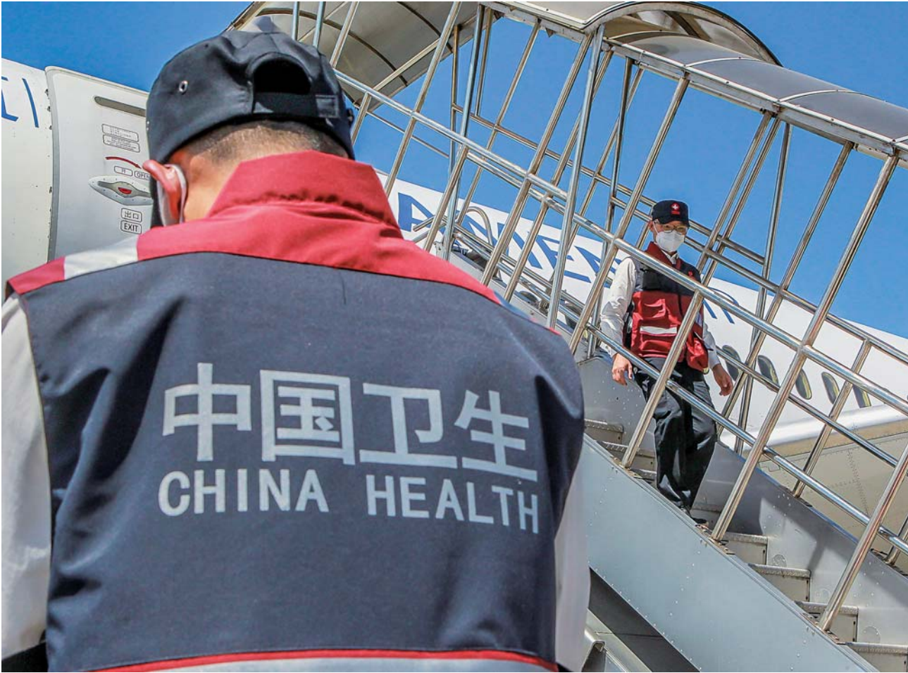
▲4月5日,中国政府向菲律宾派遣的抗疫医疗专家组抵达菲律宾马尼拉尼诺伊·阿基诺机场。中方捐赠的一批防护用品、医疗设备和中成药等抗疫物资也随机抵达。

疫情发生以来,习近平主席时刻关注国内外疫情形势,高度重视抗疫国际合作,多次作出重要指示批示,频频开展元首外交,从构建人类命运共同体高度,亲自推动疫情防控国际合作。 表达谢意与支持,传递情谊与信心,倡议团结与合作……战“疫”时期,习主席同多方密切沟通、深入交流,介绍中国抗疫努力,争取国际社会支持,呼吁各国携手抗疫,共同维护全球公共卫生安全。 分享防疫信息经验,开展药物疫苗研发合作,提供物资保障,支持国际组织发挥应有作用……战“疫”期间,习主席利用各种场合向世界阐明积极参与全球抗疫的中国立场,发出凝聚全球战“疫”强大合力的中国倡议。 夙夜在公,兼济天下。一句句真挚话语、一项项真诚倡议,让世界更真切地感受到中国领导人始终不渝的合作精神、天下情怀。 大道至简,行久致远。一场席卷全球的公共卫生危机,更加凸显人类命运共同体理念的时代价值和现实意义。 携手抗疫,共克时艰。这场共建人类命运共同体的伟大实践,必将成为21世纪人类历史的重要一章。