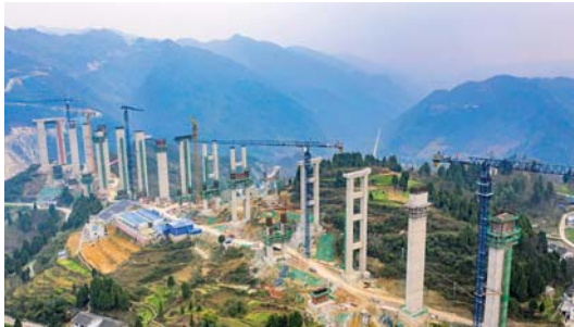
贵州遵义:团结大桥复工忙

2月27日,工人在仁遵高速团结特大桥建设工地施工。近日,仁怀至遵义高速公路团结特大桥有序复工。