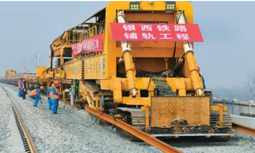
银西高铁陕西段建设复工