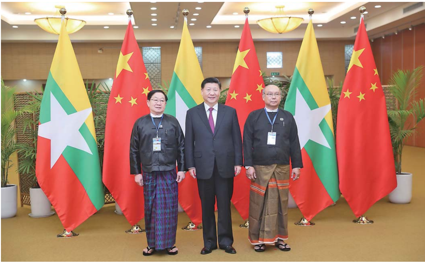
▲当地时间 1 月 17 日晚，国家主席习近平在内比都同缅甸联邦议会议长兼人民议长蒂昆密和民族议长曼温凯丹进行友好交谈。