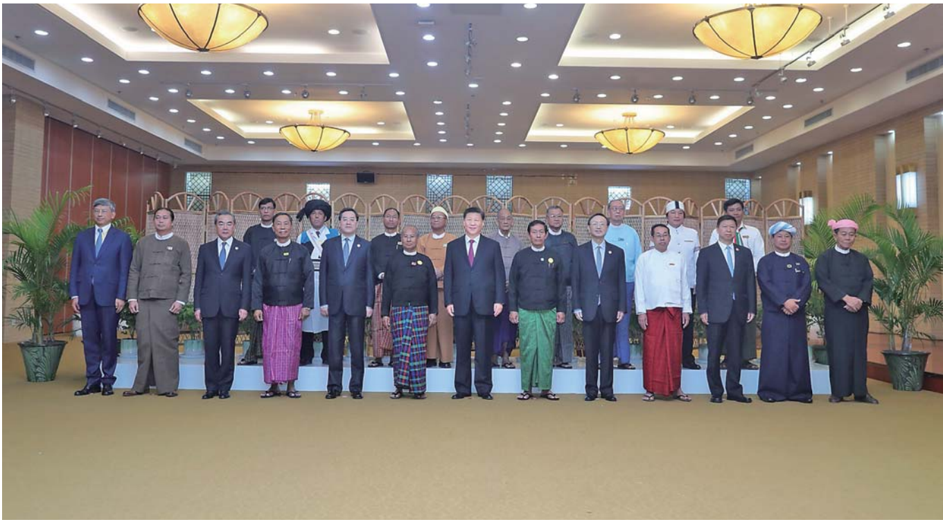
▲当地时间 1 月 17 日晚，国家主席习近平在内比都同缅甸主要政党领导人集体合影留念。