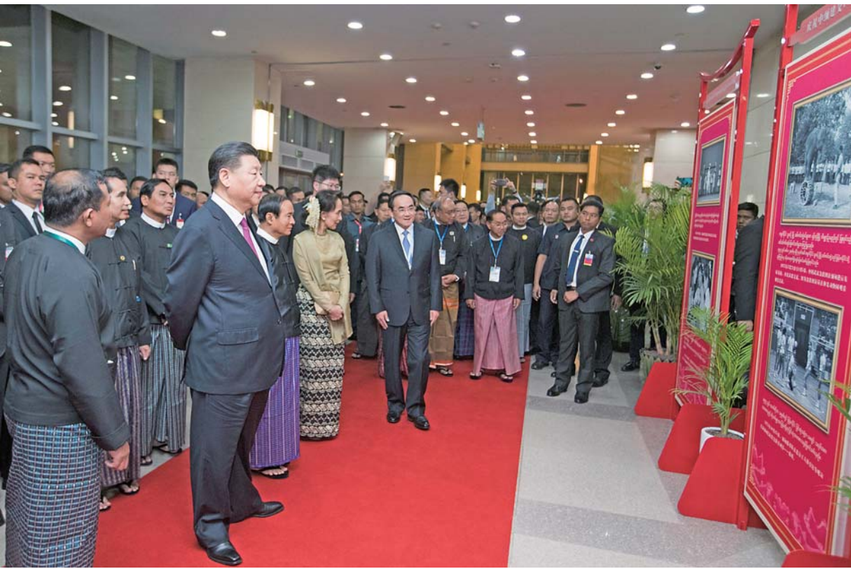
▲当地时间 1 月 17 日晚，国家主席习近平在内比都第二国际会议中心出席中缅建交 70 周年庆祝活动暨中缅文化旅游年启动仪式。这是仪式开始前，习近平在缅方领导人陪同下，观看庆祝中缅建交 70 周年图片展。 新华社记者黄敬文摄

(上接 1 版)两国领导人一同欣赏了中缅两国艺术家呈现的精彩演出。身着民族服装的缅甸艺术家手持传统工艺制成的勃生伞，先后拼出“缅甸”、“中国”两个英文单词。勃生伞宛若一朵朵美丽的鲜花瞬间绽放出数字“70”，象征着对中缅建交 70 周年的美好祝福，全场观众报以热烈掌声。