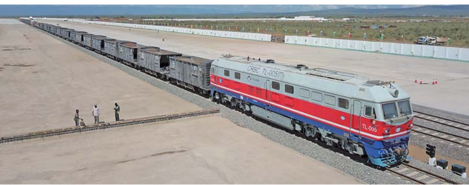
▲12月17日，一列火车停靠在肯尼亚奈瓦沙内陆集装箱港。

奈瓦沙位于东非大裂谷的平原地带，是肯尼亚著名旅游胜地，拥有丰富的旅游资源和农业资源，是肯尼亚的鲜花出口基地，也是