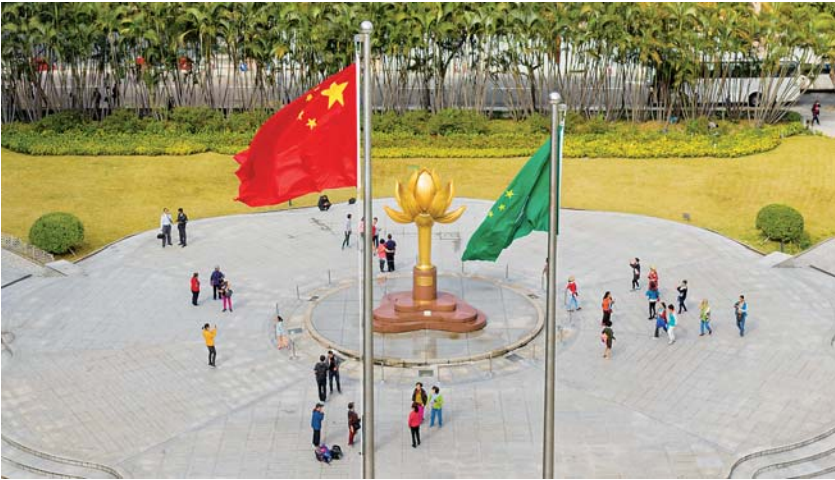
▲这是12月13日无人机拍摄的澳门莲花广场。

诚如习近平主席会见新当选的澳门特别行政区第五任行政长官贺一诚时所讲:事实证明,“一国两制”是完全行得