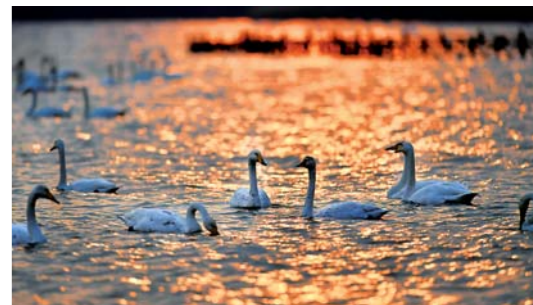
山西平陆：白天鹅“冬约”

12月12日，白天鹅在山西平陆黄河湿地水面上游弋。每年秋冬，白天鹅都会从西伯利亚来到这里越冬。