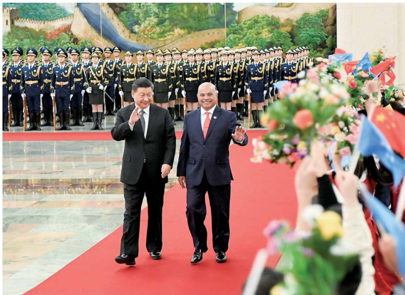
▲12月13日，国家主席习近平在北京人民大会堂同密克罗尼西亚联邦总统帕努埃洛会谈。这是会谈前，习近平在人民大会堂北大厅为帕努埃洛举行欢迎仪式。

新华社北京12月13日电(记者白洁)国家主席习近平13日在人民大会堂同密克罗尼西亚联邦总统帕努埃洛会谈。习近平欢迎帕努埃洛在中密建交30周年之际访华，赞赏他一直以来积极致力于发展对华关系，坚定恪守一个中国原则。习近平指出，中国坚持走和平发展道路，坚持大小国家一律平等，坚决反对单边主义