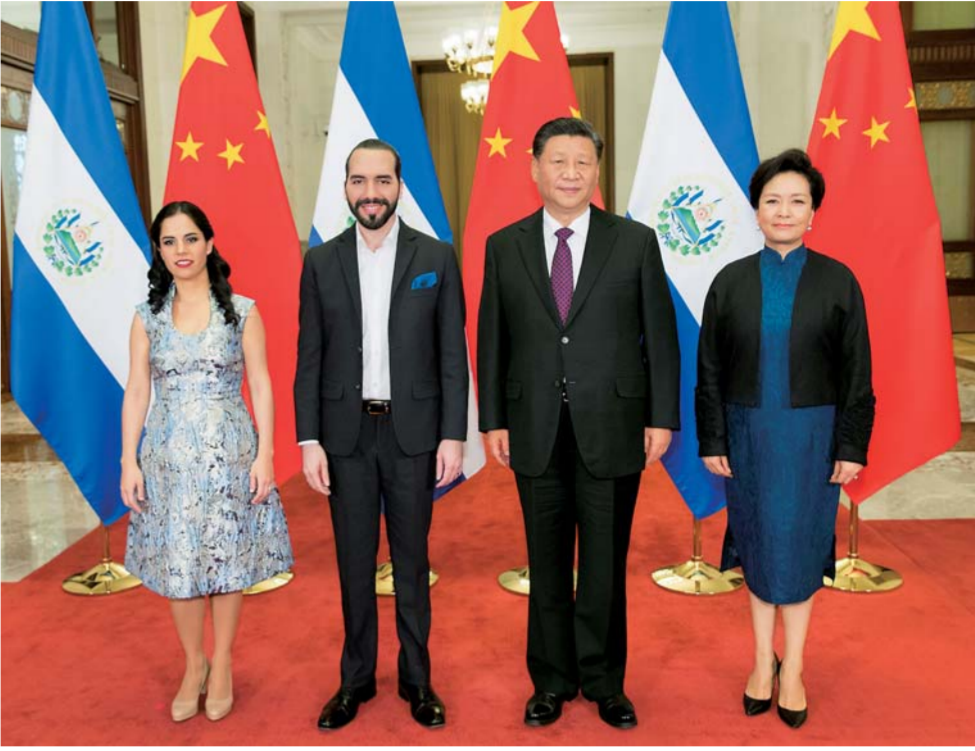
▲12月3日,国家主席习近平在北京人民大会堂同萨尔瓦多总统布克尔会谈。这是会谈前,习近平和夫人彭丽媛同布克尔总统夫妇合影。

洛文尼亚前总统图尔克等外方嘉宾先后发言,热烈祝贺中华人民共和国成立70周年,表示钦佩中国发展取得的伟大成就,赞赏中国为维护世界和平、促进可持续发展作出的重要贡献,中国人民现在享有前所未有的自由,相信中国作为有重要影响力的大国将继续发展繁荣,实现中华民族伟大复兴的中国梦。他们表示,中国坚持改革开放,将使世界各国特别是发展中国家受益。而当前个别国家主张本国优先,奉行单边主义,导致冲突摩擦增多。世界需要坚持多边主义,完善全球治理,构建更加公平、公正、多元化的国际秩序。习近平主席提出的构建人类命运共同体、共建“一带一路”等重要倡议,对于维护世界和平繁荣、促进世界多极化和实现可持续发展具有重大积极意义,期待中方继续为应对气候变化等全球性挑战发挥重要引领作用。各方愿同中方一道,坚持多边主义,共建“一带一路”,推动构建相互尊重、合作共赢的新型国际关系。 会见前,习近平同外方嘉宾集体合影。 杨洁篪、王毅等参加会见。