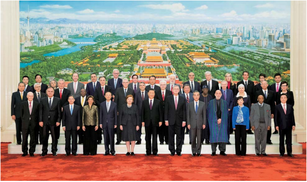
▲12月3日,国家主席习近平在北京人民大会堂会见出席“2019从都国际论坛”外方嘉宾。这是会见前,习近平同外方嘉宾集体合影。

新华社北京12月3日电(记者白洁)国家主席习近平3日在人民大会堂会见出席“2019从都国际论坛”外方嘉宾。 习近平介绍了中国治国安邦之路和对当前国际形势的看法。习近平指出,今年是中华人民共和国成立70周年,这种历史性年份总会给人们带来深层次思考。新中国成立70年来,取得了伟大的发展成就。行稳才能致远。中国特色社会主义道路是中国能够不断发展稳定的最根本原因,得到了全中国人民的衷心拥护和支持。我们将坚定不移继续沿着我们选择的道路走下去。中国将继续坚持改革开放,如期实现“两个一百年”奋斗目标。我对中国的未来充满信心。 习近平指出,一方水土养一方人。中国历来主张各国人民有权选择符合自身国情的发展道路。世界上没有哪一个国家和民族能够通过亦步亦趋、走别人的道路来实现自己的发展振兴,也没有一条一成不变的道路可以引导所有国家和民族实现发展振兴。中国要以自己的实践证明,国强未必称霸。这首先是中国五千年历史文化传统决定的,中国人没有扩张侵略的基因,秉持的是天下大同、天