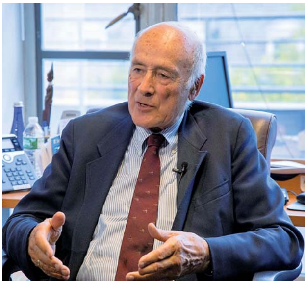
▲ 10 月 8 日,在美国马萨诸塞州的哈佛大学,美国哈佛大学著名国际政治学者、“软实力”和“巧实力”概念的首创者约瑟夫·奈教授接受新华社记者专访。

——中美关系未来依然乐观 宋怡明说,他对中美关系的未来依然乐观,一是与中国合作意味着巨大的经济收益,二是美国最终还是要承认和承担它的国际责任,特别是在应对气候变化方面的责任。 专家们提出,中美应在气候变化、金融稳定、贸易体系、全球卫生等领域加强合作,同时建议商人、学生、学者等“非国家行为体”发挥