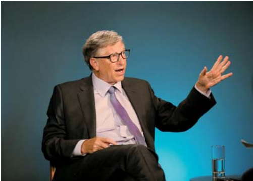
▲ 11 月 13 日,在美国西雅图,比尔及梅琳达·盖茨基金会联席主席比尔·盖茨接受新华社记者专访。