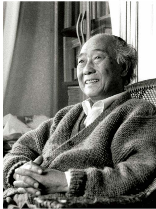
左上图:汪曾祺全集精装本立体。 上图:1961年全家在北京中山公园。 左图:《羊舍一夕》手稿。 右图:1990年2月摄于家中。