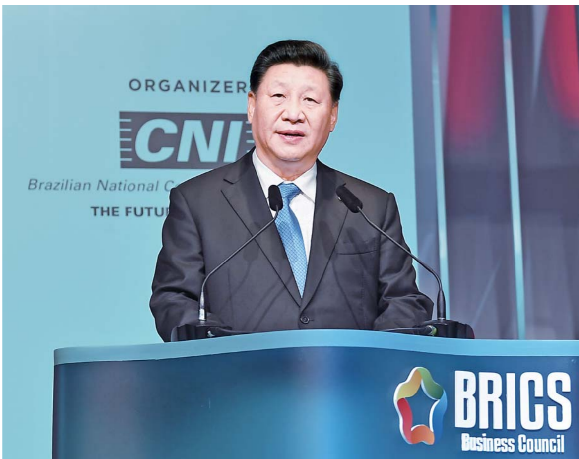
习近平出席并发表讲话。

新华社巴西利亚11月13日电（记者裴剑容、杨依军）当地时间11月13日，金砖国家工商论坛闭幕式在巴西利亚举行。国家主席习近平出席并发表讲话。巴西总统博索纳罗、俄罗斯总统普京、印度总理莫迪、南非总统拉马福萨一同出席闭幕式。 习近平指出，一段时间来，世界形势又发生许多新变化，既充满机遇，也有不少挑战。新一轮科技革命和产业变革动能逐渐释放，为生产力进步和经济社会发展开辟了新天地。同时，保护主义、霸凌主义逆流而动，冲击国际贸易和投资，加剧世界经济下行压力。企业有信心，市场就有活力。希望工商界朋友们抓住机遇，应对挑战，继续发挥各自优势，踊跃参与和推动金砖国家经济合作，积极在金砖国家投资兴业，为促进增长、创造就业作出实实在在的贡献。 习近平指出，金砖国家新工业革命伙伴关系是下阶段金砖经济合作的一个重要抓手。要敢于先行先试，将企业合作同新工业革命伙伴关系结合起来，争取在创新、数字经济、绿色经济等领域拿出更多亮眼成果，助力五国经济实现高质量发展。 习近平指出，当前，经济全球化遭遇逆风。要找出阻碍各国经贸投资往来的难点和痛点，提出切实可行的解决建议，帮助政府更好地了解行业和市场诉求，提高决策水平。 习近平强调，中国的发展是世界的机遇。面向未来，中国扩大对外开放的决心没有变，中国经济长期向好趋势没有变。我们将进一步开放市场，扩大进口，不断改善营商环境，为企业创造更好的发展条件。共建“一带一路”已经进入高质量发展新阶段，希望企业家们抓住机遇，积极参与，收获更多合作成果。 金砖国家工商界代表约600人出席闭幕式。 当晚，习近平和夫人彭丽媛出席博索纳罗和夫人金为钢夫妇举行的欢迎宴会，并一同观看了文艺演出。 丁薛祥、杨洁篪、王毅、何立峰等参加上述活动。