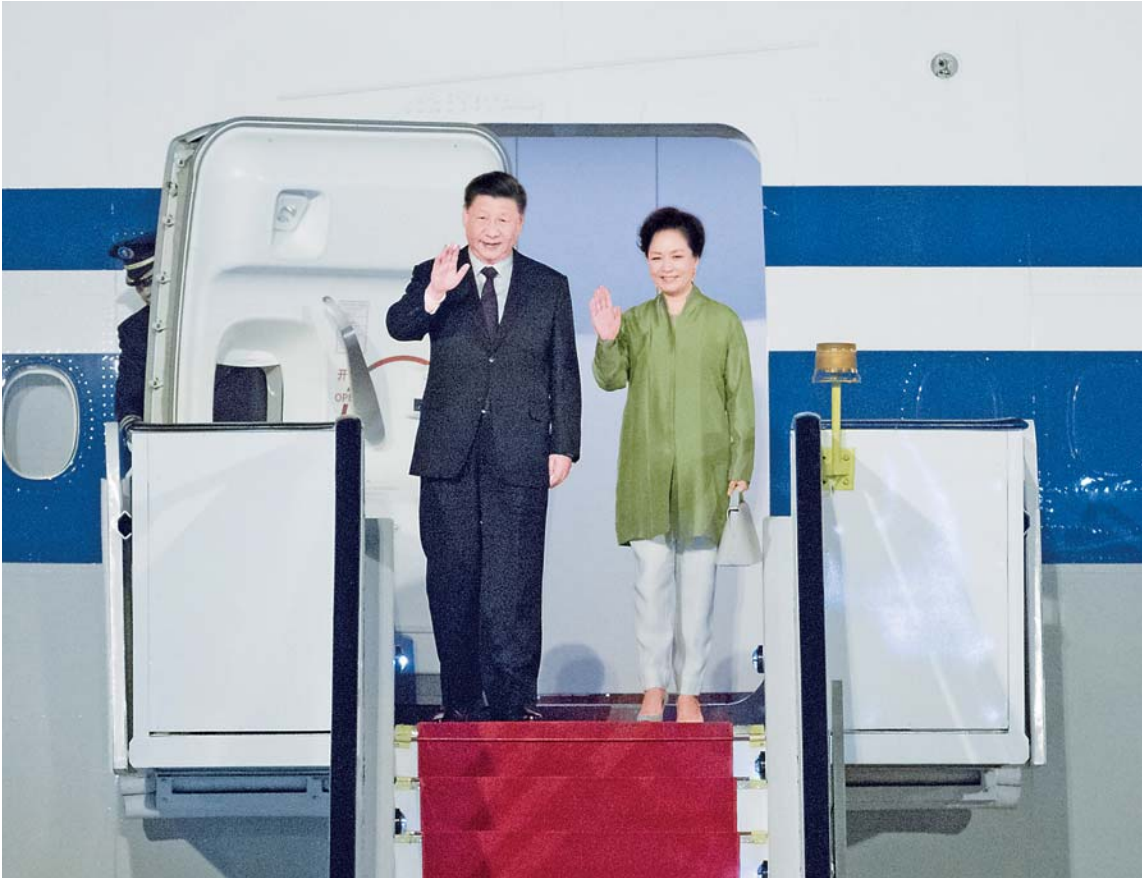
▲当地时间11月12日晚,国家主席习近平乘专机抵达巴西利亚,出席金砖国家领导人第十一次会晤。这是习近平和夫人彭丽媛步出专机舱门。

道,推动会晤取得成果。 博索纳罗表示,不久前我对中国成功进行国事访问,我们就发展巴中关系达成很多共识,我指示巴方有关部门尽快落实。中国是世界举足轻重的大国,是巴西第一大贸易伙伴。巴西人民对中国人民怀有敬佩、尊重和友好的情谊,巴中合作对巴西的未来发展具有日益重要意义。巴中经济具有很强互补性,合作领域日益拓展。巴方欢迎中国企业来巴投资,在基础设施建设和铁矿石、油气等能源领域加强合作。巴方重视中国开放市场带来的重要机遇,希望扩大双边贸易,推动更多巴西农产品进入中国,巴方也愿为中国企业和产品进入巴西提供良好条