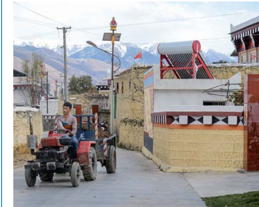
▲四川省甘孜藏族自治州道孚县麻孜乡沟尔普旅游新村入口(10月31日摄)。