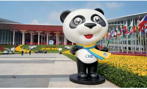
第二届进博会今日开幕

11月4日,进博会吉祥物“进宝”在国家会展中心(上海)南广场安放到位。第二届进博会于11月5日上午在上海开幕。