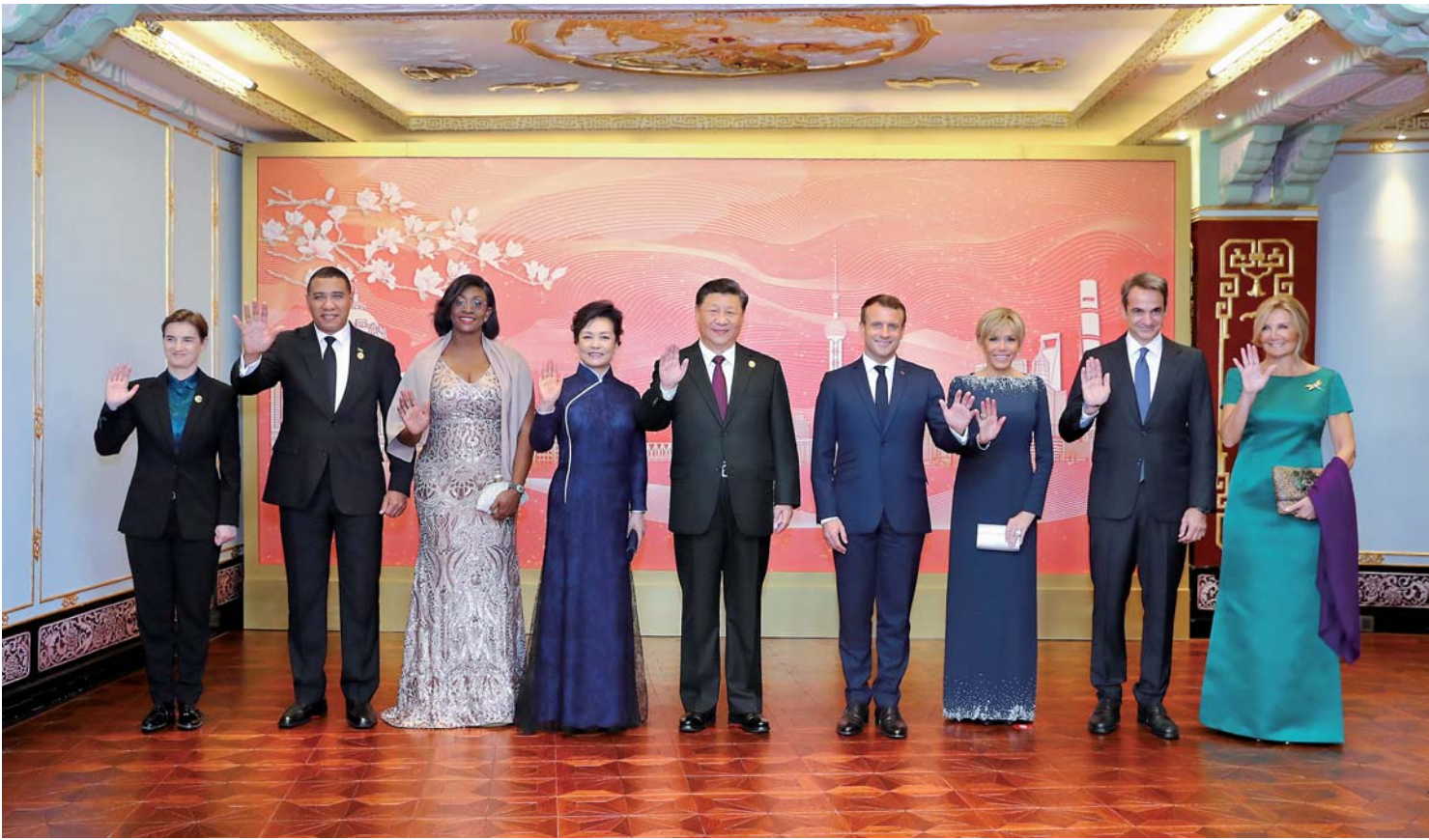
▲11月4日晚,国家主席习近平和夫人彭丽媛在上海和平饭店举行宴会,欢迎出席第二届中国国际进口博览会的各国贵宾。这是宴会前,习近平和彭丽媛同法国总统马克龙夫妇、牙买加总理霍尔尼斯夫妇、希腊总理米佐塔基斯夫妇、塞尔维亚总理布尔纳比奇等外方贵宾合影留念。