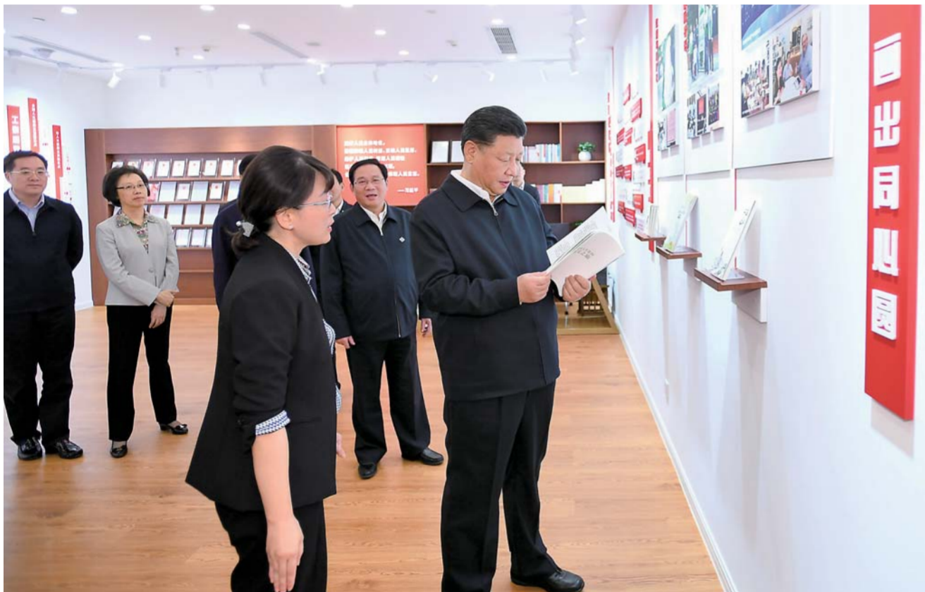
▲2日下午,习近平在长宁区虹桥街道古北市民中心考察,了解社区开通社情民意直通车、服务基层群众参与立法工作等情况。