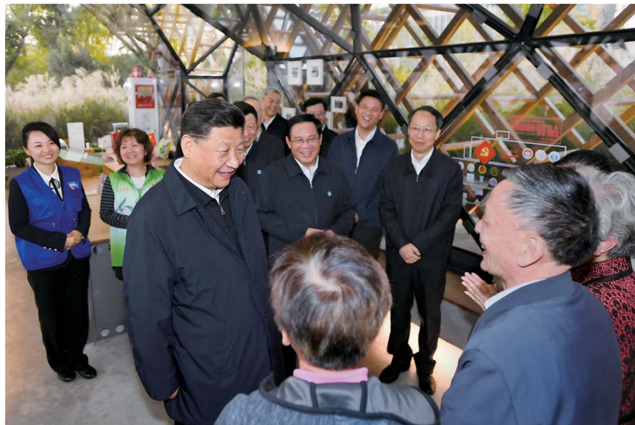
▲2日下午,习近平在杨浦区滨江公共空间杨树浦水厂滨江段人人屋党群服务站,同服务站工作人员和居民交谈,了解基层党建和公共服务情况。