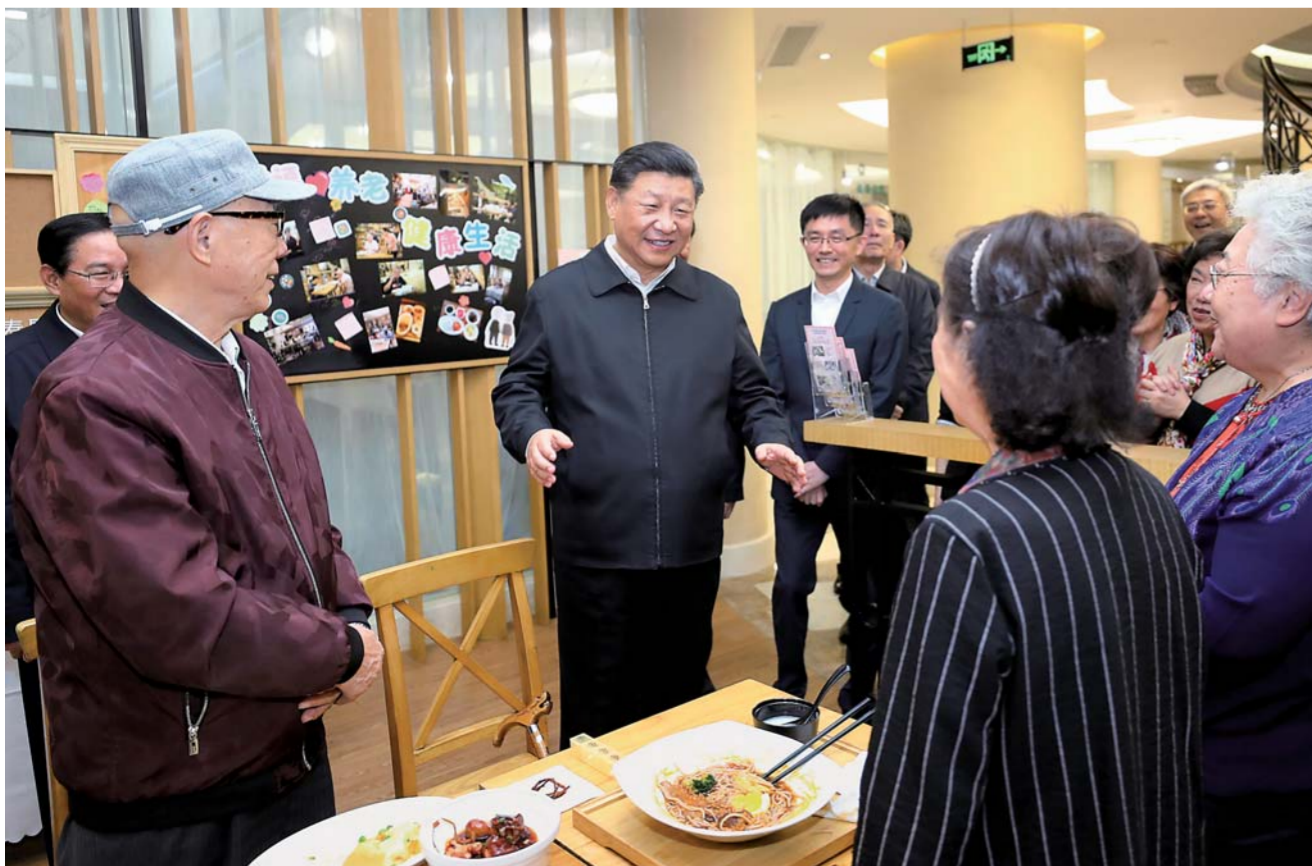
▲2日下午,习近平在长宁区虹桥街道古北市民中心老年助餐点,同正在用餐的居民热情交谈。