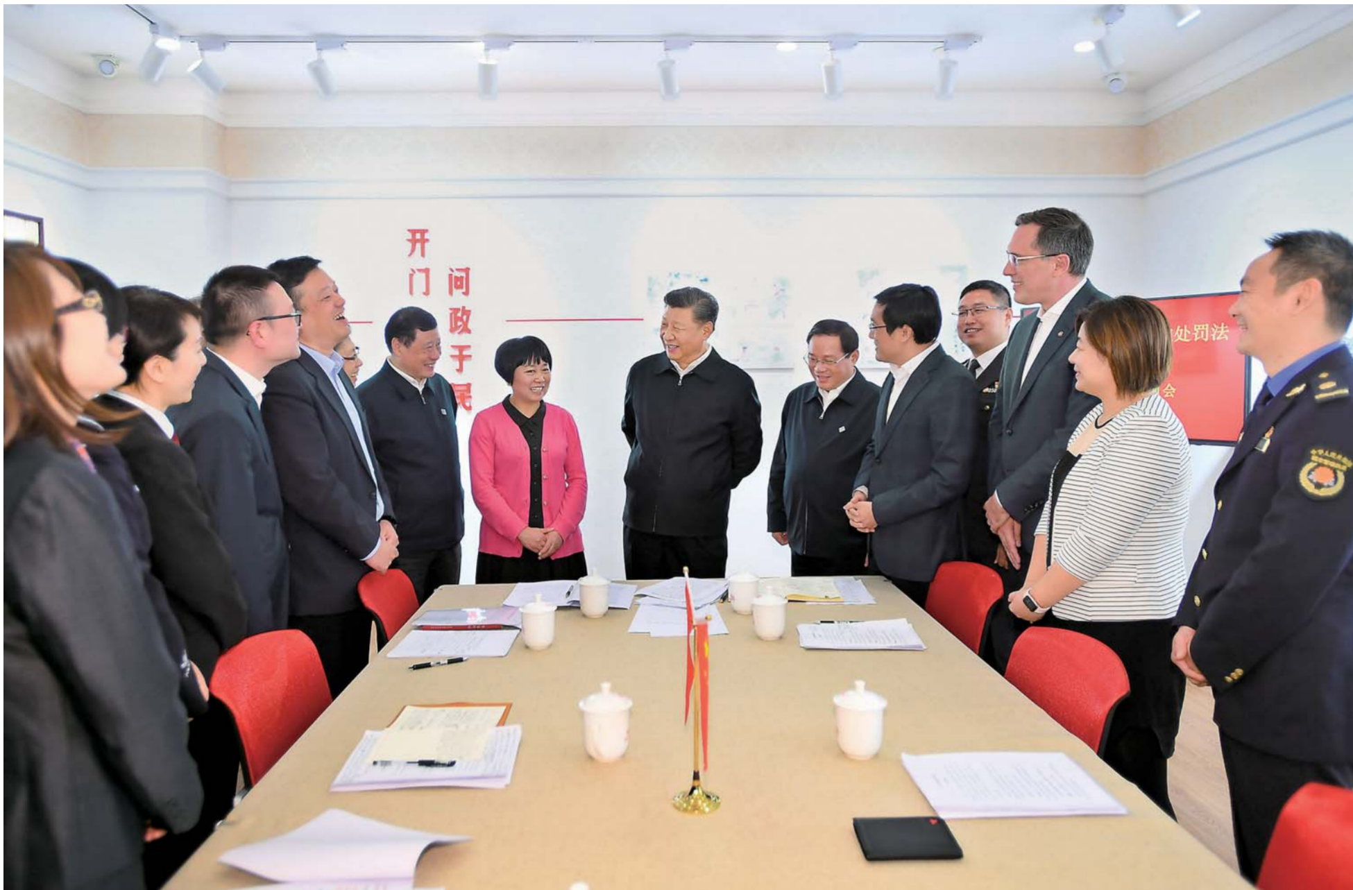
▲11月2日至3日,中共中央总书记、国家主席、中央军委主席习近平在上海考察。这是2日下午,习近平在长宁区虹桥街道古北市民中心,同正在参加立法意见征询的社区居民代表亲切交流。