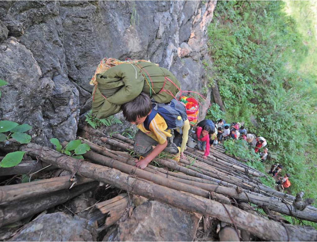
右图：2012年7月4日，弄勇村弄顶屯的孩子们扛着生活用具爬悬梯回家。

新华社北京10月16日电（侯雪静、骆晓飞、王博、白丽萍）10月17日是第六个国家扶贫日，也是第二十七个国际消除贫困日。这一天，离中国人摆脱绝对贫困的目标已近在咫尺。