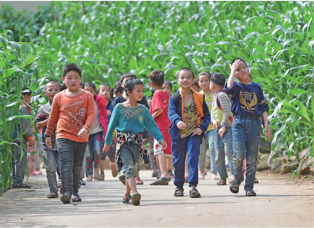
左图：2019年5月10日，广西大化瑶族自治县板升乡弄勇村孩子们走在新修的放学路上。