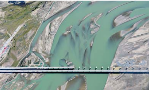
西藏：空中的美景长廊 国庆期间，来自国内外的游客乘机前往西藏观光旅游，在飞往拉萨的飞机上鸟瞰高原，欣赏高原独特的美景。