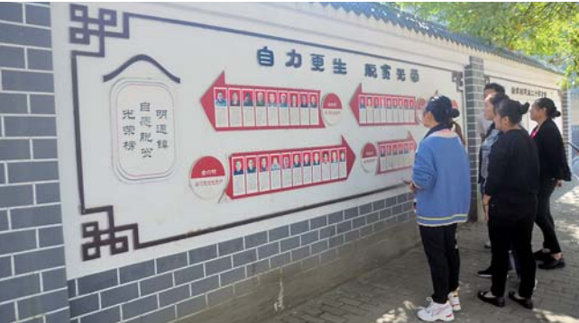
▲9月26日，村民们正在观看城口县明通镇政府旁的“自愿脱贫光荣榜”。