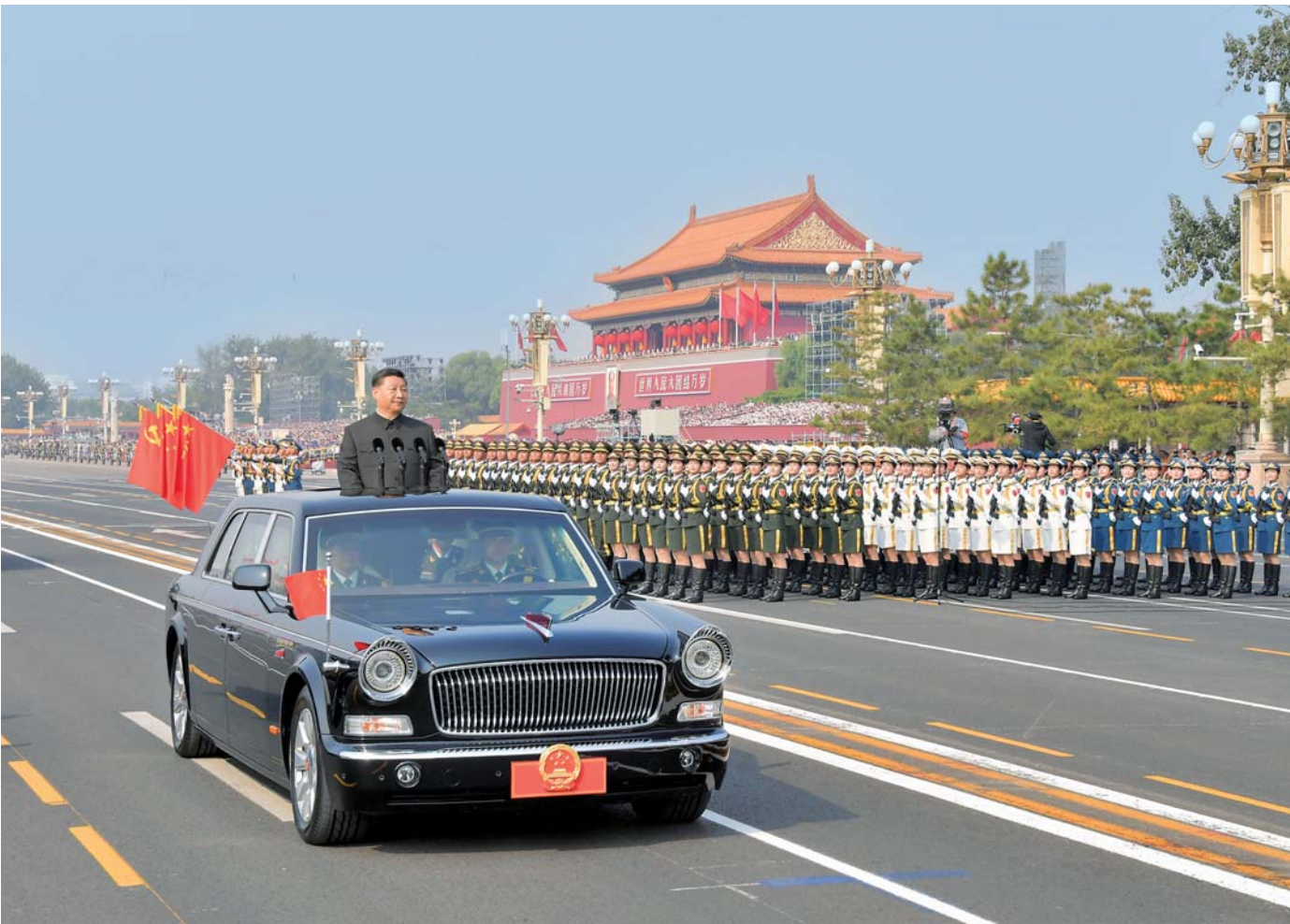
▲10月1日,庆祝中华人民共和国成立70周年大会在北京天安门广场隆重举行。这是中共中央总书记、国家主席、中央军委主席习近平检阅受阅部队。