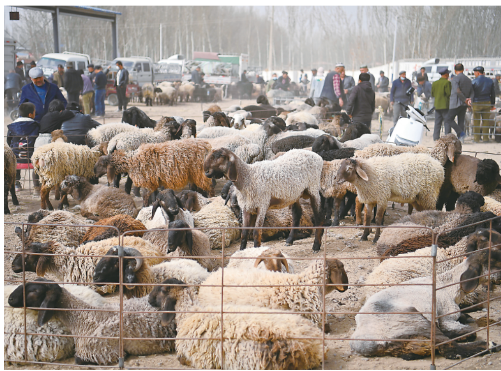
▲新疆莎车县米夏镇的牛羊巴扎(3月12日摄)。在南疆，巴扎由当地约定俗成，在邻近几个乡镇每周轮流进行。每逢巴扎天，周边的老乡和各地游客纷纷涌入，购买百货，买买牛羊，交友聚会，享受美食。

“羊！拦住我的羊！”早春清晨，在新疆维吾尔自治区喀什地区莎车县的牛羊巴扎上，几位牧民合力把横冲直撞的小羊赶回羊群，引起周围一阵笑声。这个小插曲并未影响市场秩序。在他们身后，载满牲畜的车辆排起长龙，正等候通过检疫后进场交易。