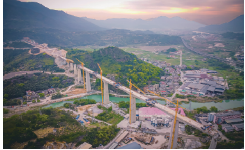
这是浙江永嘉县杭温铁路陡门溪特大桥施工现场(4月3日摄)。陡门溪特大桥连续梁于4月1日凌晨合龙。