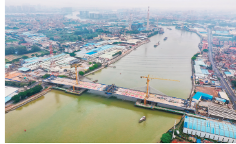
4月2日,中铁四局承建的东莞榷马特大桥主跨顺利合龙,该桥是东莞中(堂)洪(梅)路工程控制性节点。