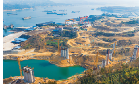
2月20日,工人在三峡库区湖北省宜昌市秭归县三峡枢纽茅坪港疏港铁路建设工地施工。

今日8版 总第11011期 / 国内统一连续出版物号CN 11-0209 邮发代号1-19 / 新华网:news.cn 新华每日电视网:mr dx.cn