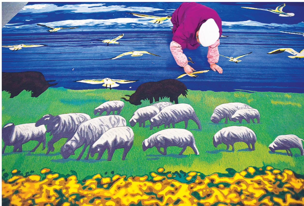
2月21日,在青海西宁市圣源地毯集团有限公司生产车间,操作工检查毯面、拔花刺。随着旅游业复苏,藏毯需求量增加,圣源地毯集团有限公司加紧赶制款式精美的藏毯,确保订单按时交付。据介绍,今年1月份,圣源地毯集团有限公司销售额同比增长27%,目前接到的国内外订单已排到3月底。

地处三峡库区腹地的涪陵区是重庆市的老工业基地。上世纪八九十年代,涪陵人在工业基础薄弱的条件下锐意进取,打造了“一碟菜、一盒药、一瓶水、一包烟、一袋肥、一块砖、一匹布、一锭铝、一个件”9个品牌产品,被誉为9朵“金花”,做大做强了太极制药、涪陵榨菜集团等一批知名企业。(下转5版)