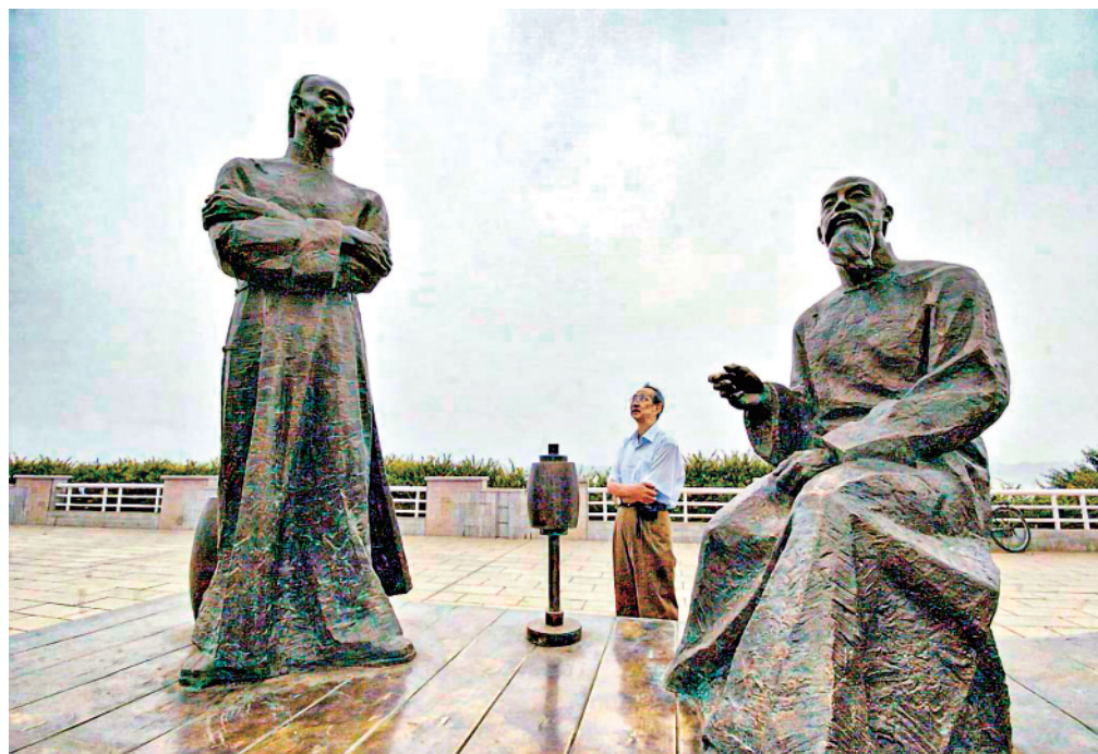
▲位于长沙市潇湘大道上的以民族英雄林则徐和左宗棠为主题的巨型青铜雕塑《湘江夜话》。该雕塑讲述的是林则徐和左宗棠 1849 年在长沙湘江边会面，并彻夜长谈抵御西方列强入侵、保卫新疆的历史故事。

舍我其谁，拼命担当，左宗棠可谓书生报国，戎马一生，屡建奇功。正如曾国藩所言：“国幸有左宗棠也”