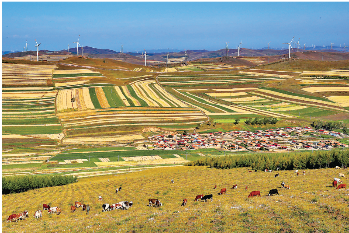
▲河北省坝上地区沽源县草原天路沿线风光。