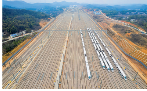
12月26日,由中铁五局承建的渝厦高铁长沙西动车运用所正式开通运营。