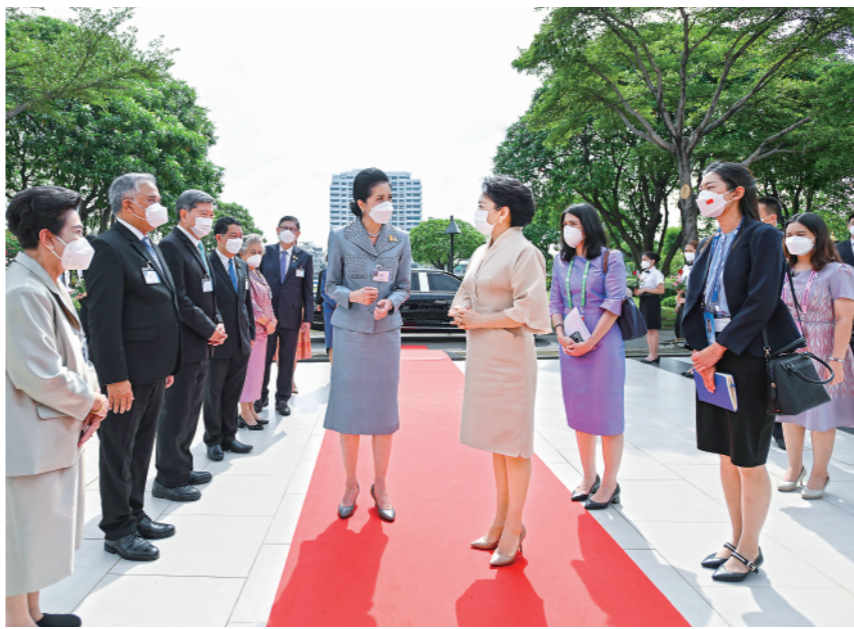
▲当地时间11月19日上午，国家主席习近平夫人彭丽媛在泰国总理夫人娜拉蓬陪同下参观甘拉雅尼音乐学院。这是彭丽媛抵达时，娜拉蓬等热情迎接。

新华社曼谷11月19日电(记者杨依军、陈家宝)当地时间19日上午，国家主席习近平夫人彭丽媛在泰国总理夫人娜拉蓬陪同下参观甘拉雅尼音乐学院。