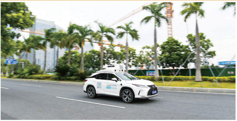
◀这是10月17日在广东广州南沙区拍摄的小马智行自动驾驶出租车。