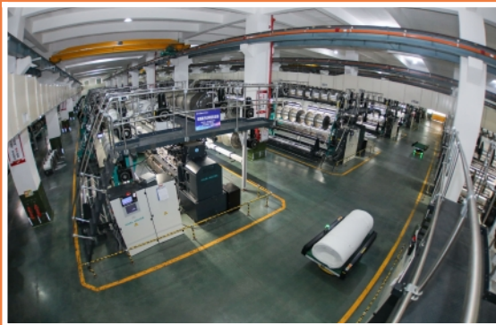
▲10月16日，在福建晋江华宇铮莹集团智能化车间，AGV物流机器人在搬运经编成品。