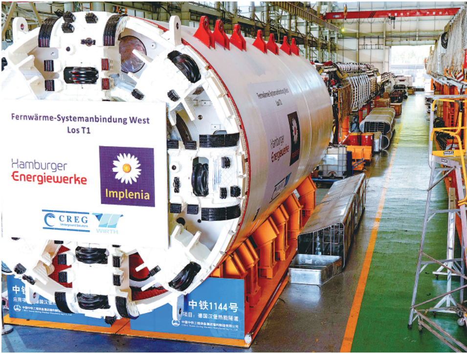
▲10月16日在河南郑州拍摄的中铁装备首台出口德国的盾构机。

“习近平总书记在二十大报告中提出，推动绿色发展，促进人与自然和谐共生。我们相信，会有越来越多的人参与到长江江豚保护中，携手共绘大美长江生态画卷。”郝玉江说。