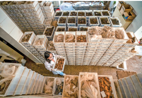
▲考古工作者在整理云南河泊所遗址出土的遗物(9月21日摄)。

新华社昆明9月28日电(记者伍晓阳、严勇)古滇国考古获得重大突破:去年以来,云南河泊所遗址出土大量汉代封泥和简牍。这表明西汉中央政府已对云南行使治权,是我国统一多民族国家形成与发展的重要实证。 在28日国家文物局举行的“考古中国”重大项目发布会上,云南省文物考古研究所发布了河泊所遗址最新考古成果。 河泊所遗址位于昆明市晋宁区上蒜镇河泊所村附近,是古滇文化的核心居址区。其东北约一公里便是曾出土金质“滇王之印”的石寨山古墓群。 云南省文物考古研究所所长刘正雄介绍,去年以来的考古发掘揭露出主体为两汉时期的文化堆积,发现建筑基址、灰坑、墓葬、河道、水井等重要遗迹,出土封泥、简牍、铜器、铁器、骨器、玉石器等文化遗物2000多件。 “其中最重要的发现为封泥、简牍、大型建筑基址、道路等。”刘正雄说。封泥共发现500