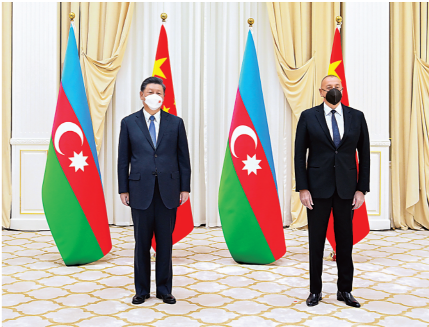
▲当地时间9月15日下午,国家主席习近平在撒马尔罕国宾馆会见阿塞拜疆总统阿利耶夫。

新华社乌兹别克斯坦撒马尔罕9月15日电(记者范伟国、石昊)当地时间15日下午,国家主席习近平在撒马尔罕国宾馆会见阿塞拜疆总统阿利耶夫。