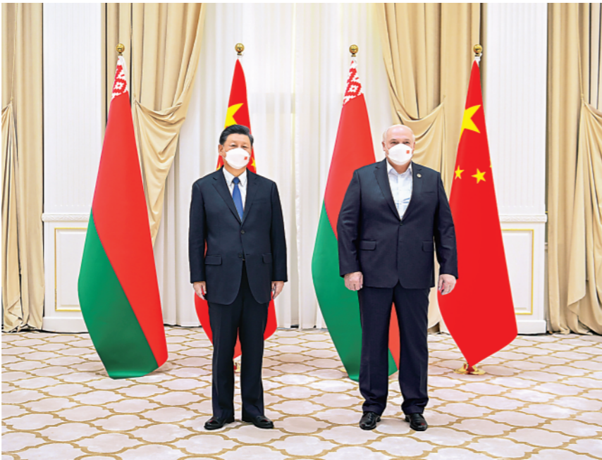
▲当地时间9月15日下午,国家主席习近平在撒马尔罕国宾馆会见白俄罗斯总统卢卡申科。

习近平强调,在涉及中方核心利益问题上,白方始终给予中方坚定支持,中方对此高度评价。中方坚定支持白方走符合本国国情的发展道路,反对外部势力以任何借口干涉白俄罗斯内政,愿同白方推动落实全球发展倡议和全球安全倡议,维护国际公平正义。中方愿同白方保持密切交往,在投资、经贸等领域开展互利共赢合作,推动中白工业园区朝着绿色、智慧、生态、数字化方向发展。双方要继续举办好中白地方合作年活动,开展高校人才联合培养。中方愿继续为白方抗击新冠肺炎疫情提供支持和帮助。