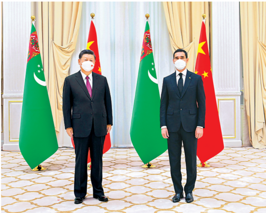
▲当地时间9月15日上午,国家主席习近平在撒马尔罕国宾馆会见土库曼斯坦总统谢尔达尔·别尔德穆哈梅多夫。

新华社乌兹别克斯坦撒马尔罕9月15日电(记者刘华、刘恺)当地时间15日上午,国家主席习近平在撒马尔罕国宾馆会见土库曼斯坦总统谢尔达尔·别尔德穆哈梅多夫。