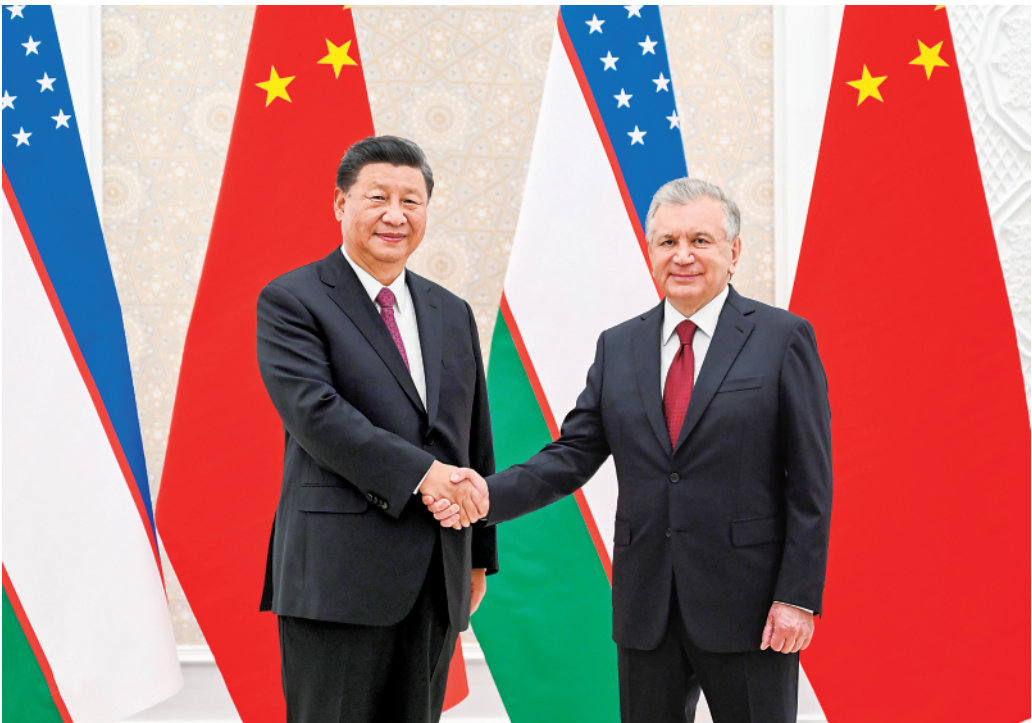
▲当地时间9月15日,国家主席习近平在撒马尔罕同乌兹别克斯坦总统米尔济约耶夫会谈。

新华社乌兹别克斯坦撒马尔罕9月15日电(记者倪四义、范伟国)当地时间9月15日,国家主席习近平在撒马尔罕同乌兹别克斯坦总统米尔济约耶夫会谈。两国元首宣布,着眼中乌关系长远发展和两国人民未来福祉,双方将扩大互利合作,巩固友好和伙伴关系,在双边层面践行命运共同体。