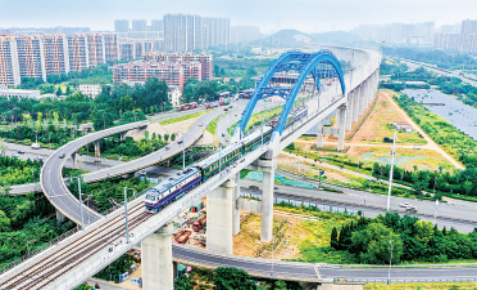
9月15日,济(南)莱(芜)高铁联调联试正式启动,5座新建站房也已进入装饰装修阶段。