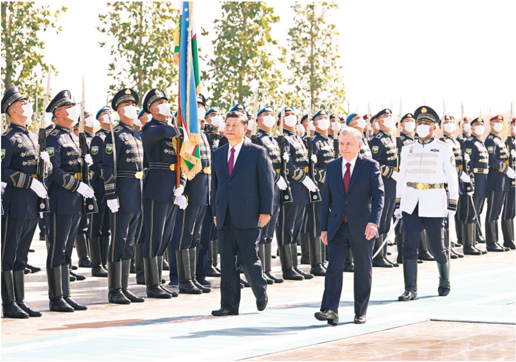
▲当地时间9月15日,国家主席习近平在撒马尔罕同乌兹别克斯坦总统米尔济约耶夫会谈。会谈前,米尔济约耶夫为习近平举行隆重欢迎仪式。