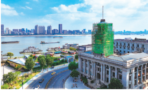
近日,湖北武汉对著名地标江汉关钟楼启动保护修缮(9月15日摄)。