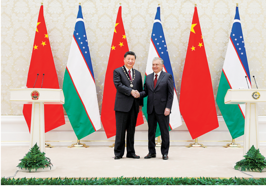
▲当地时间9月15日,国家主席习近平在撒马尔罕国际会议中心接受乌兹别克斯坦总统米尔济约耶夫授予“最高友谊”勋章。

米尔济约耶夫致授勋辞。他表示,今天是有重要历史意义的一天。我非常荣幸向习近平主席颁授首枚乌兹别克斯坦对外最高荣誉——“最高友谊”勋章。习近平主席为增进乌中友谊、巩固相互信任、深化两国合作作出了重大贡献。乌兹别克